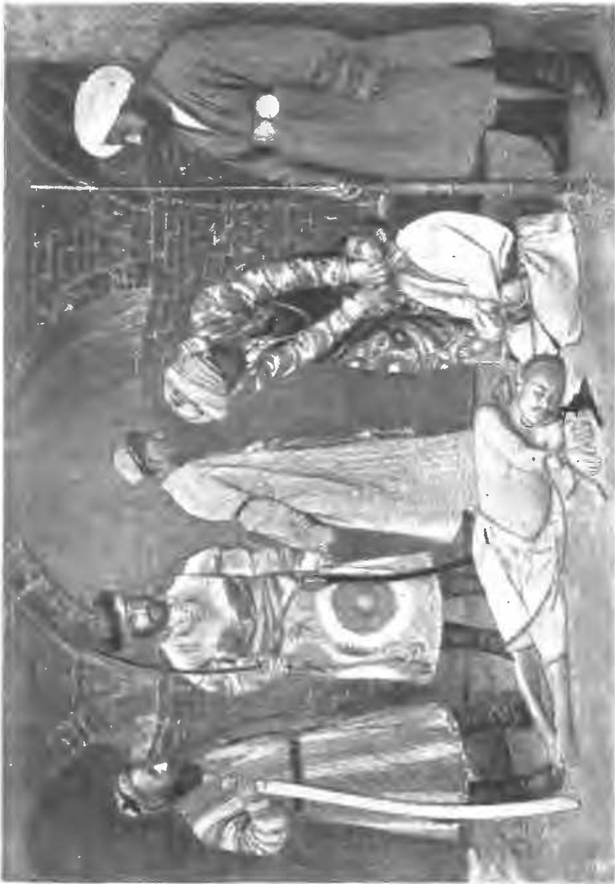
Смертная казнь въ Бухарѣ.