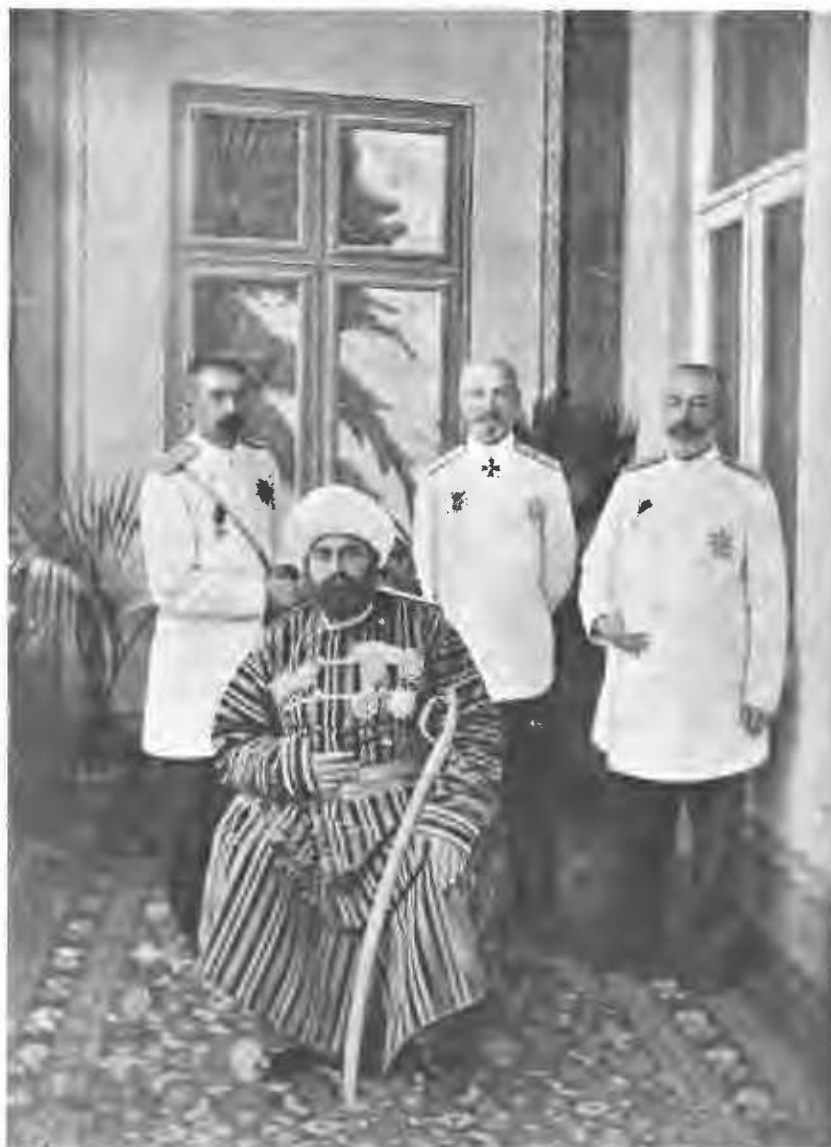
Эмиръ бухарскій Миръ-Сеидъ-Абдуль-Ахадъ и его свита. (Въ серединѣ авторъ воспомнаній).