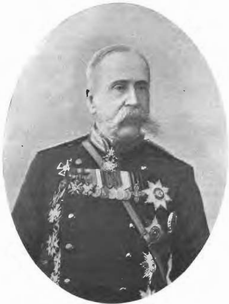
Николай Николаевичъ Тевяшовъ. 1903—1905 г.

помощникъ слѣпому исполнителя своихъ распоряженій. На такую роль Наливкинъ не могъ, очевидно, согласиться тѣмъ болѣе, что и законъ предоставляетъ вице-губернатору извѣстную самостоятельность. Послѣдоваль цѣлый рядъ конфликтовъ; отношенія между