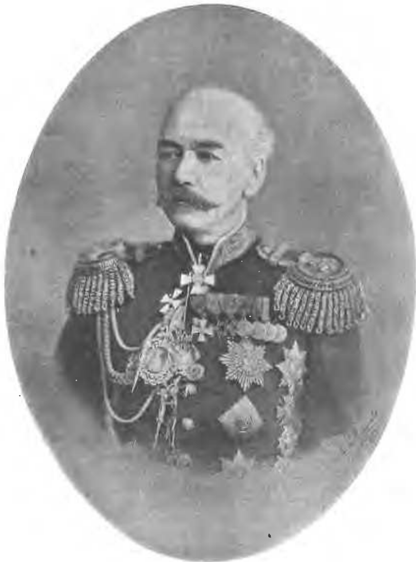
Константи́нъ Петро́вичъ фонъ-Кауфманъ.