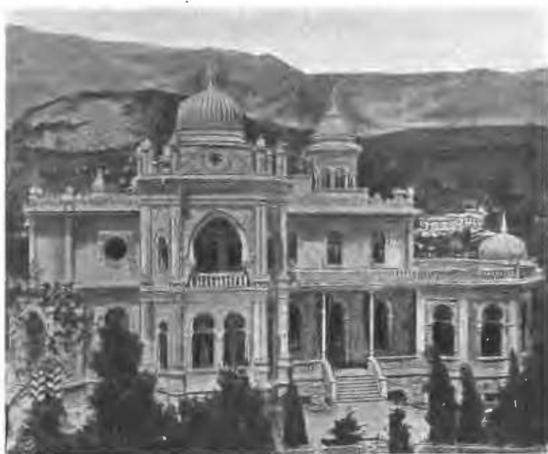
Дворецъ эмира бухарскаго въ Ялтѣ.