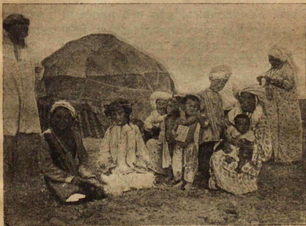
Рис. 1. Казакская семья.

ного мяса. Если ребенок плохо спит, то, очевидно, потому, что его обнюхала собака. Тут без знахаря не обойтись. Знахарь-баксы начинает шептать различные заклинания, и в то же время подвергает малютку самым ужасным гимнастическим упражнениям, дергая его кверху то за руку, то за ногу, пока измученное дитя не заснет. Детей своих казачки кормят весьма долго, иногда до