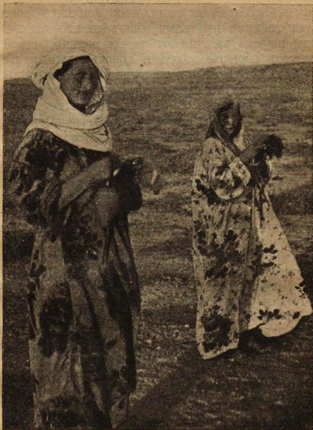
Рис. 2. Казачки в степи за работой.

кормить детей, доить скот и смотреть за ним, обшивать семью, собирать и готовить топливо, что