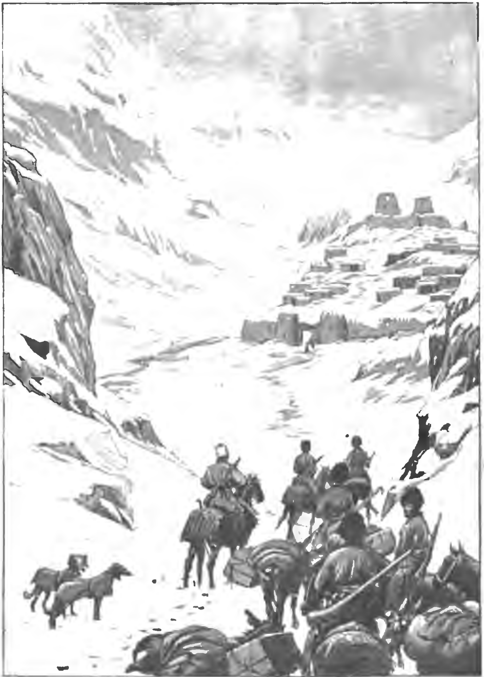
КУРДСКАЯ КРѢПОСТЬ. 1883 г.

ВРЪЗКЕ КЪ «РУССКОЙ СТАРИЦѢ» изд. 1908 г.