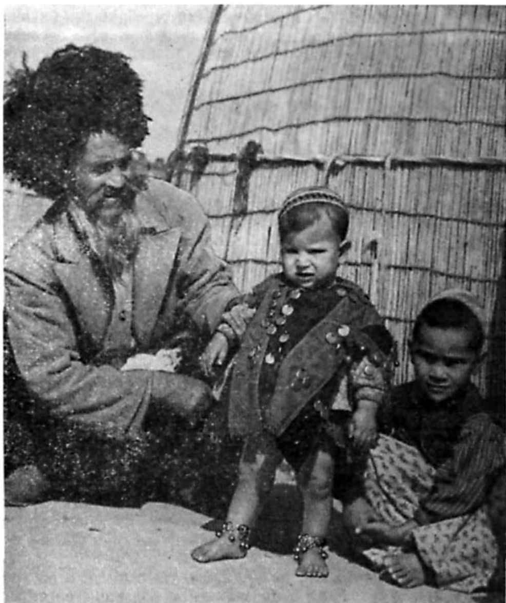
Рис. 2. Серебряный браслет бурма на ножку ребенка

Так, почти всем туркменам были известны ножные серебряные или медные браслеты, которые надевали на одну или обе щиколотки ребенка [ бурма — у текинцев, йомутов; шихиль ( ишгиль ) — у сарыков]; эти браслеты часто бывали с бубенчиками, причем носили их и девочки и мальчики от 1—1,5 до 3—4 лет, обычно в тех семьях, где часто умирали дети.