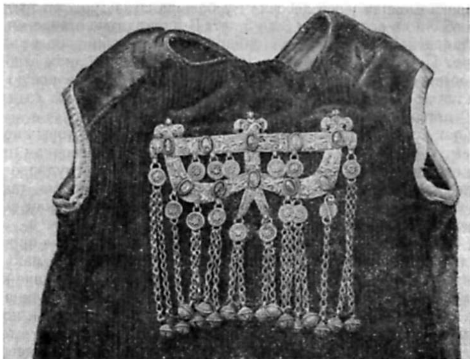
Рис. 3. Ок-яй — украшение-амулет на халатик мальчика

трубочки — тумар , плоские шелестящие подвески — шельпе и другие серебряные украшения с подвесками и сердоликовыми вставками. Йомуты, как западные, так и северные, не привешивали бязбент на спину; у них это украшение было парным и укреплялось на плечах ала елека или халатика. На спине одежды обычно пришивался красный треугольник из сукна, на котором укреплялись тумар , деревянный дагдан или серебряная дога , другие обереги и монетки.