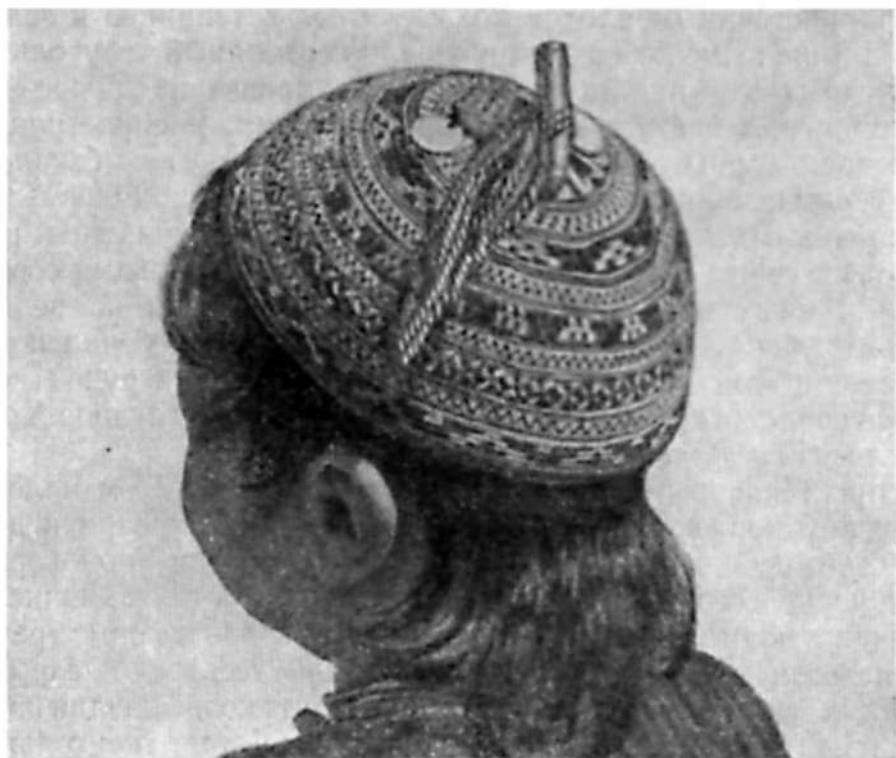
Рис. 1. Украшения детской шапочки

несколько позднее, у девочек появлялись специфические девичьи украшения; мальчикам же лет с 7—8 уменьшали количество украшений, оставляя лишь немногие (например, серебряную застежку на вороте рубахи), которые они носили зачастую до самой женитьбы. В этом возрасте мальчикам обычно стригли длинные волосы на макушке — гултук и проводили обрезание, после которого они считались взрослыми. Девочки, наоборот, начинали носить больше украшений, причем с 9—12 лет многие девичьи украшения были аналогичны женским.