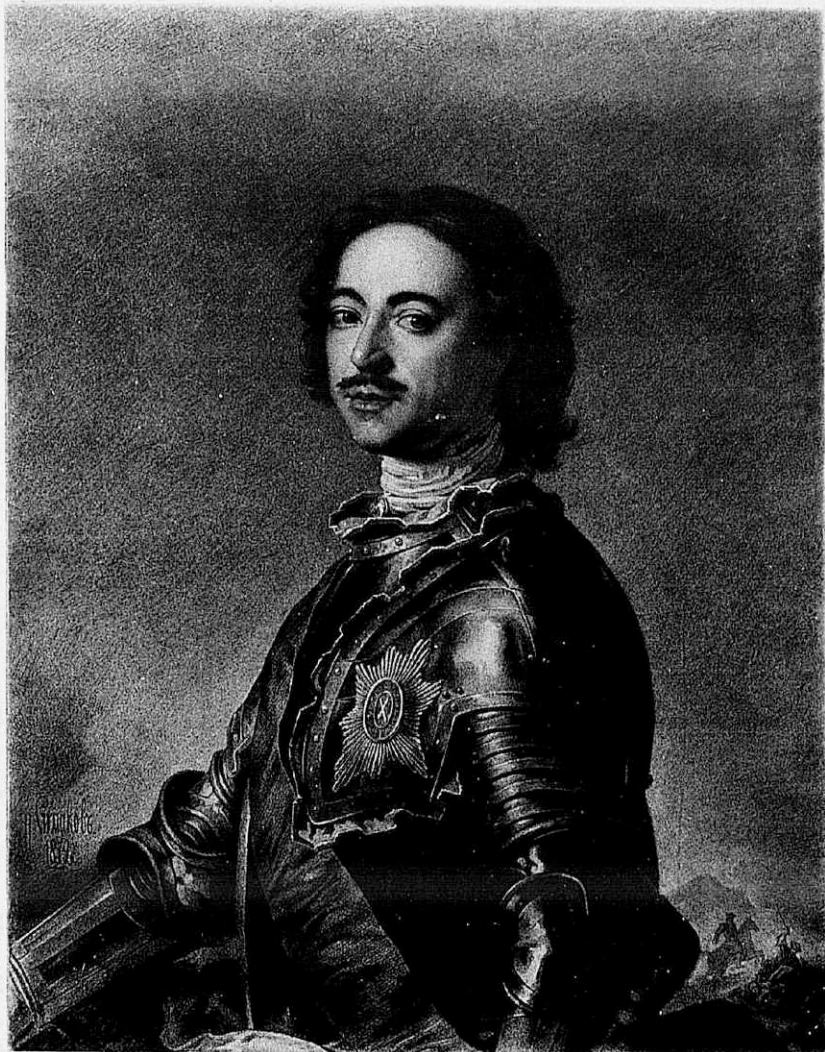
Фото-Литогр. Шерера, Набгольцъ и К о в Москвѣ

„Надлежитъ надъ гаваномъ, гдѣ бывало устье Аму Дарьѣ рѣки, построить крѣпость... Осмотрѣть прилежно теченіе оной рѣки, также и плотины... Ежели возможно опую воду пакы обратить въ старый токъ... Прочія устья запереть, которыя идутъ въ Аральское море... Осмотрѣть мѣсто близъ плотины, на настоящей Аму Дарьѣ рѣкѣ, для строенія же крѣпости..... понеже зѣло нужно.“