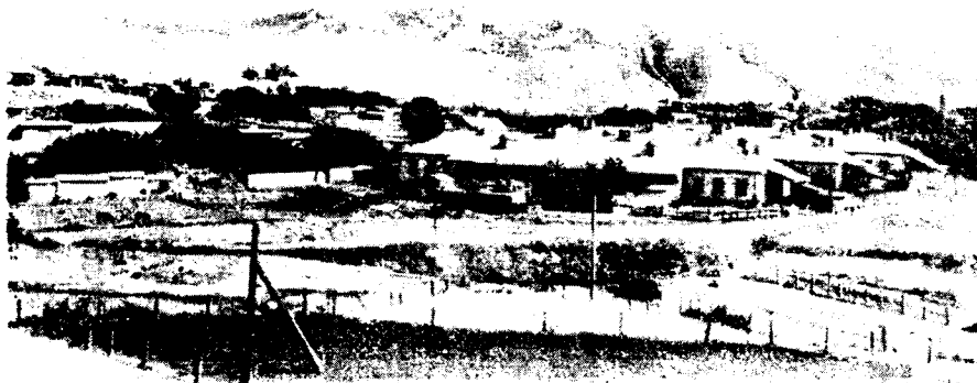
Рис. 2. Общий вид поселка Джал (часть г. Кызыл-Кия). На переднем плане многоквартирные дома рабочих

К первому из них относятся многоквартирные жилые дома, принадлежащие тресту (рис. 2). Дома этого типа построены в разное время и различаются по своей планировке и качеству. Более старые дома (их здесь называют «корпусами») имеют от 4 до 10 квартир в каждом.