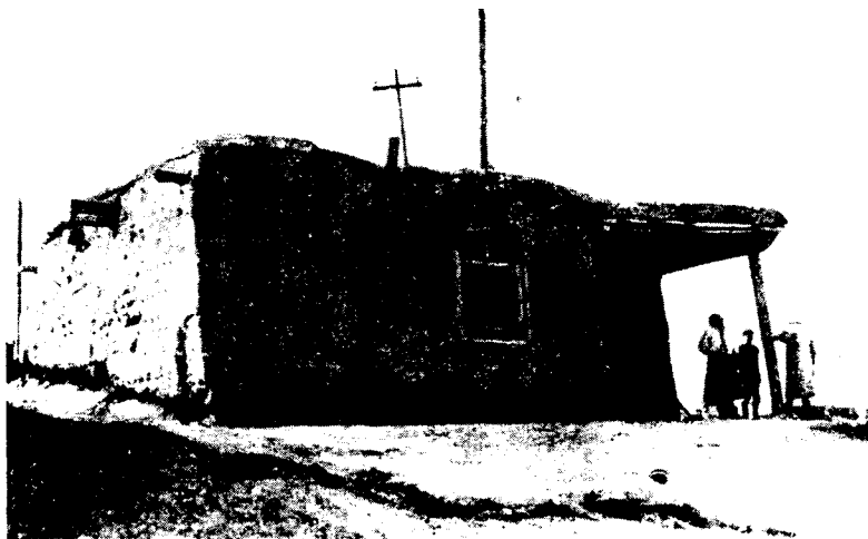
Рис. 4. Шахтерское жилище старого типа

В одежде шахтеров-киргизов преобладают формы, характерные для городского костюма, но часто наряду с ними бытуют предметы традиционной одежды. Так, не только пожилые рабочие, но и некоторые молодые наряду с пальто носят в качестве верхней одежды стеганный на вате халат (чапан) общеферганского типа, на голову надевают тубетейку «чустского» типа (черную с белой вышивкой). Поверх чапана обычно