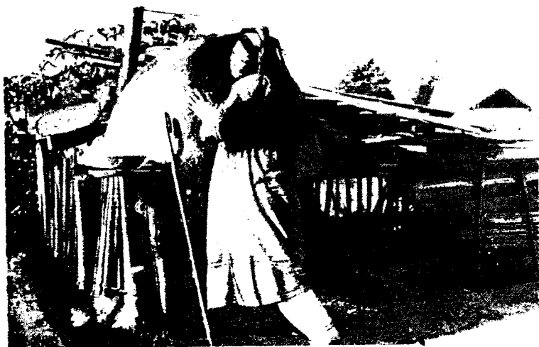
Рис. 6. Выпечка лепешек в хлебной печи „тандыр“