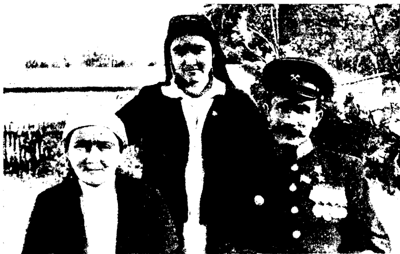
Рис. 1. Герой Социалистического Труда А. Сатыбалдыев с семьей

На шахтах треста «Кызыл-Кияуголь» из числа окончивших Горный техникум работают 22 киргиза. Среди них 13 горных мастеров, 2 электрослесаря, 2 десятника, 1 механик участка. Д. Карабаев — инженер по технике безопасности, А. Козубаев — помощник начальника шахты № 6, С. Сулейманов — начальник участка ремонтно-восстановительных работ шахты «Комсомольская», С. Мурзаев — помощник начальника участка шахты № 1—1-бис 43 . Все это новые кадры киргизской технической интеллигенции. Характерен жизненный путь этих молодых командиров производства. Так, например, 24-летний Сайдин Сулейманов родился в