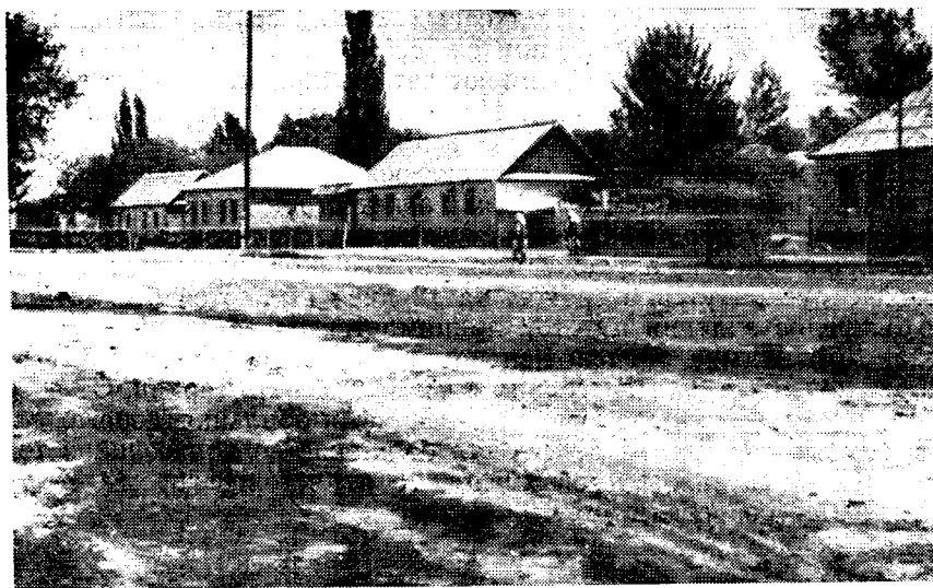
Рис. 2. Улица в селе Дархан

который будет включать швейную и сапожную мастерские, парикмахерскую и фотоателье.