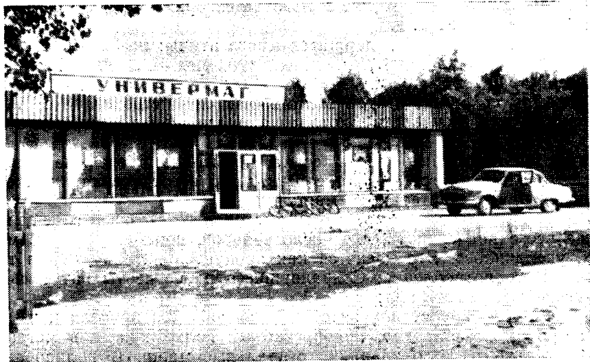
Рис. 1. Универмаг в селе Дархан