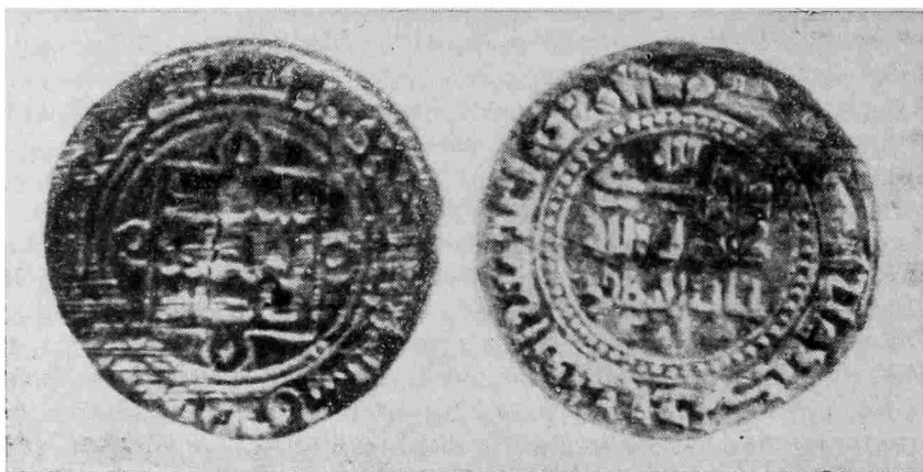
Рис. 1. Фельс Илака 391 года хиджры. Аверс и Реверс

ремесленник-портной назван дихканом, и сообщение О. И. Сухаревой о том, что в Бухаре в начале XX в. дихканами все еще называли горожан, имевших загородные участки 29 . Так выглядит вопрос об исторических судьбах дихканства, для решения которого до сих пор привлекали лишь данные средневековых письменных источников и памятников эпиграфического характера. Нумизматические данные, сколько нам известно, к решению или уточнению этого вопроса до сих пор не привлекались ни разу. А между тем данные караханидской нумизматики сообщают очень интересные сведения для освещения одного из аспектов этой проблемы.