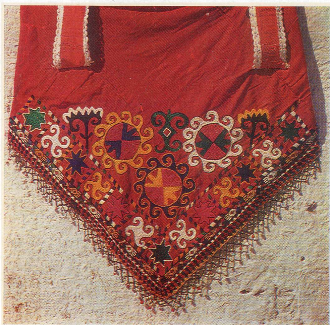
151. Вышитая сумка. 1970