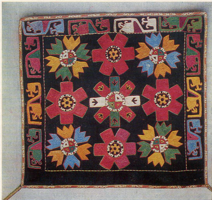
154. Вышитая сумка. 1970