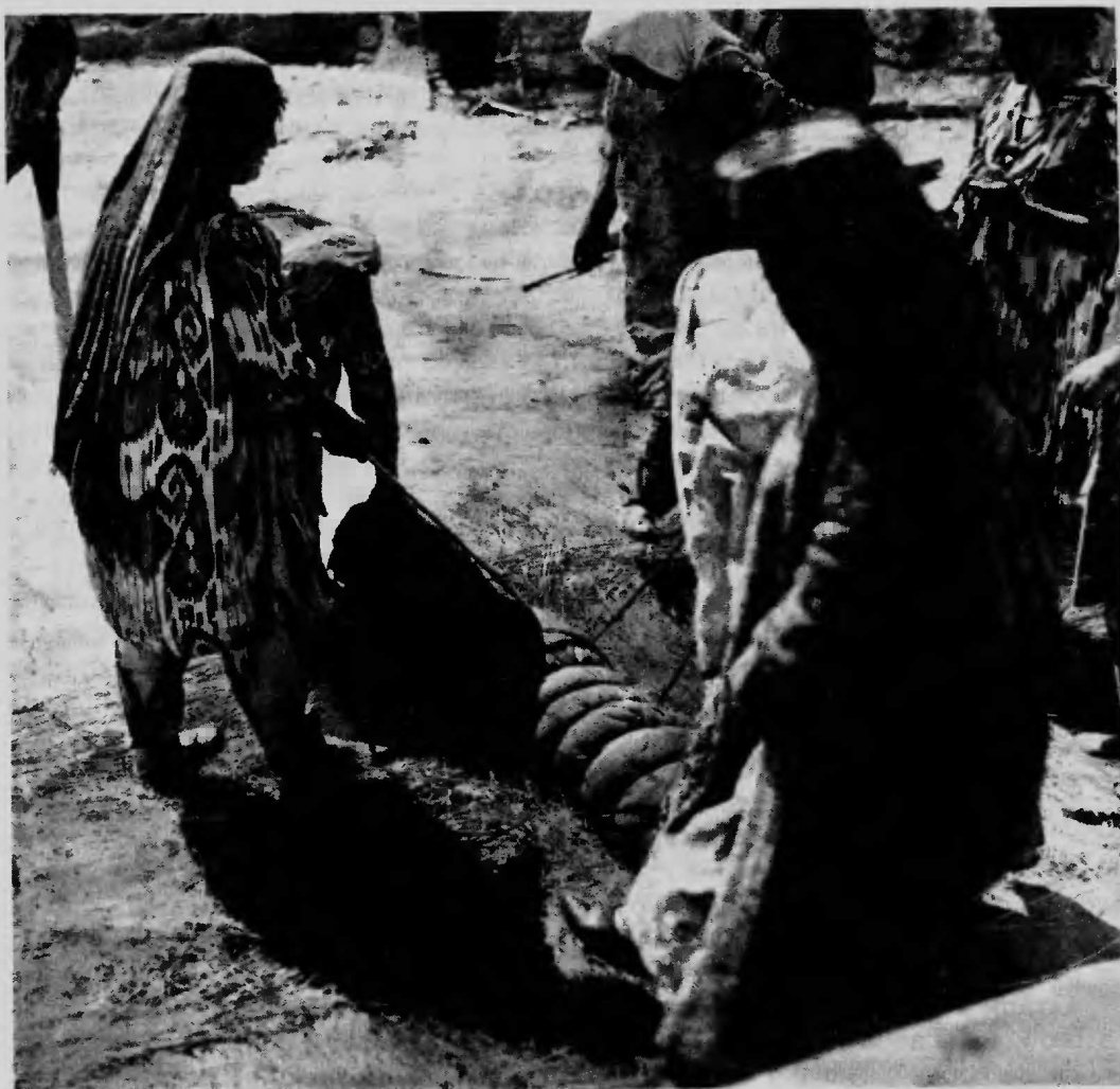
Рис. 1. Процесс валяния войлока у узбеков-катаганов

шкурам, садятся на них, чтобы несколько уплотнить основу. Затем две-три молодые женщины приступают к выкладке узоров, а пожилые свивают пряжи.