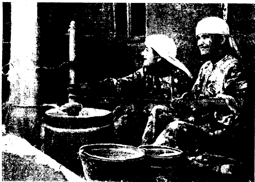
Рис. 7. Сбивание масла в маслобойке чагдег, кишлак Тагов

Не распространено гончарство и у двух других исконных групп населения Варзоба — сугути и вилояти. Это, по-видимому, объясняется тюркским происхождением этих групп.