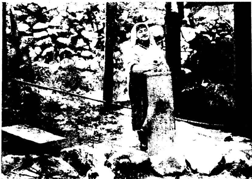
Рис. 6. Сбивание масла в маслобойке куппи, кишлак Тагов