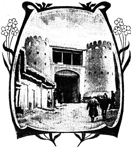
Одни изъ воротъ стѣны, окружающей Бухару.

покрываются ярко-красными цвѣтами. Тысячи разноцвѣтныхъ жучковъ гнѣздятся въ это время въ ихъ желтыхъ чашечкахъ. Распустившіеся цвѣты перемѣшиваются съ скромными замкнутыми бутонами; темно-зеленые мелкіе шелковистые листья гранатника еще болѣе оттѣняютъ яркость его цвѣтовъ.