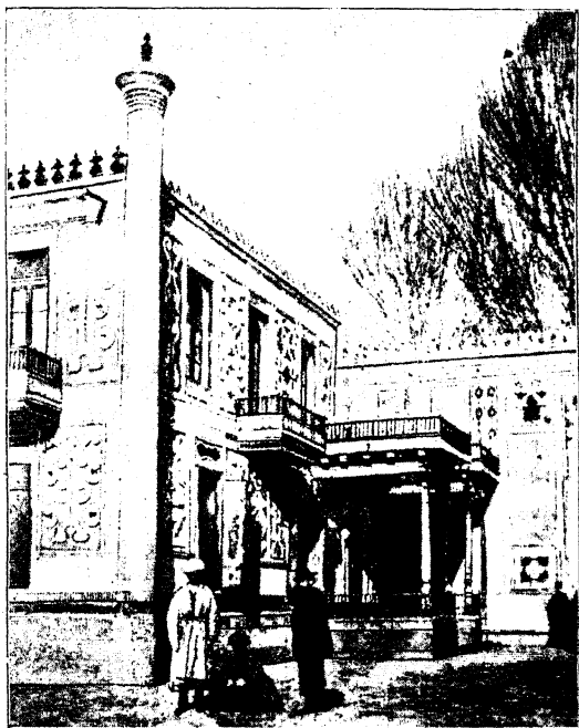
Одинъ изъ дворцовъ Его Высочества Эмира Бухарскаго.

Права его опредѣляются законами 27 мая 1887 г. и 11 мая 1888 г. Ему подсудны иски до 2000 р., сумма, превышающая въ 4 раза компетенцію мирового судьи въ Имперіи.