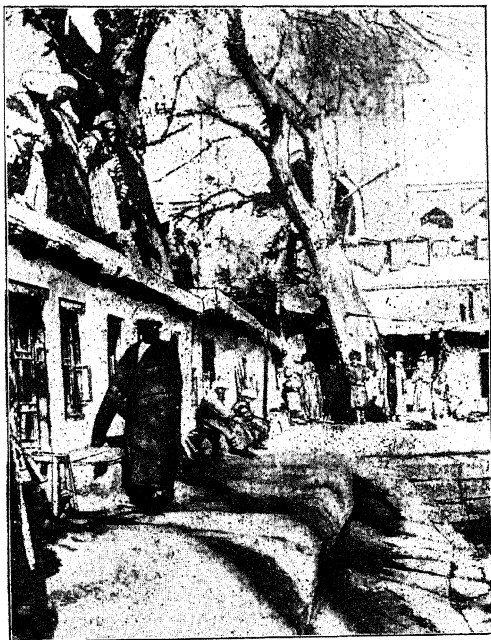
Лавки у водоема Лябихаузъ.

Я не поклонникъ восточной музыки вообще, а бухарская произвела на меня еще болѣе невыгодное впечатлѣніе. Трудно въ словахъ передать этотъ хао-