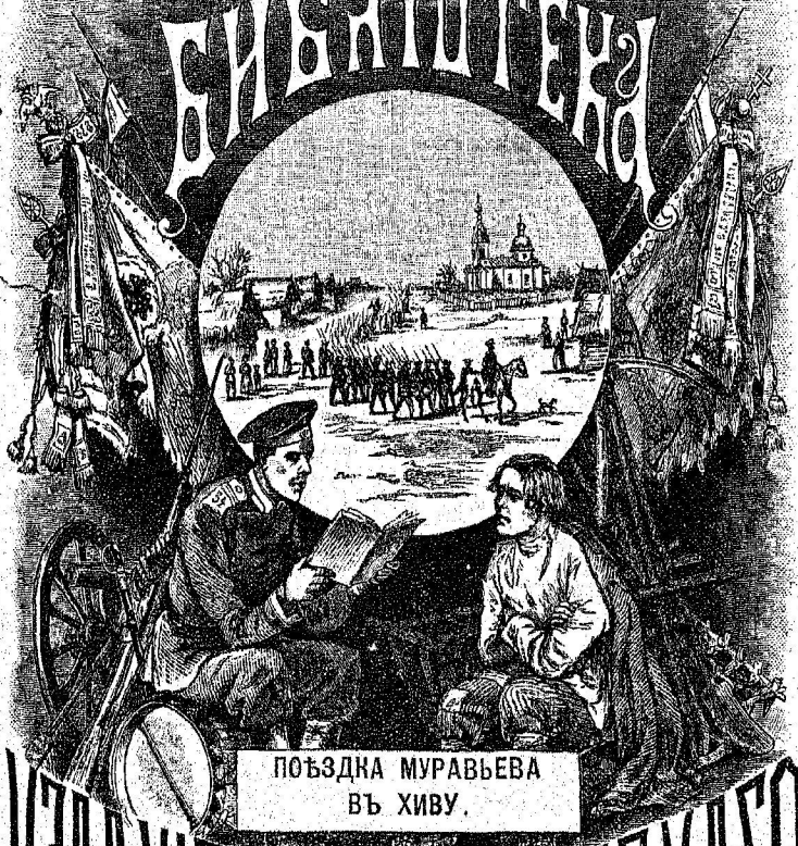
ПОЊЗДНА МУРАВЬЕВА ВЪ ХИВУ.