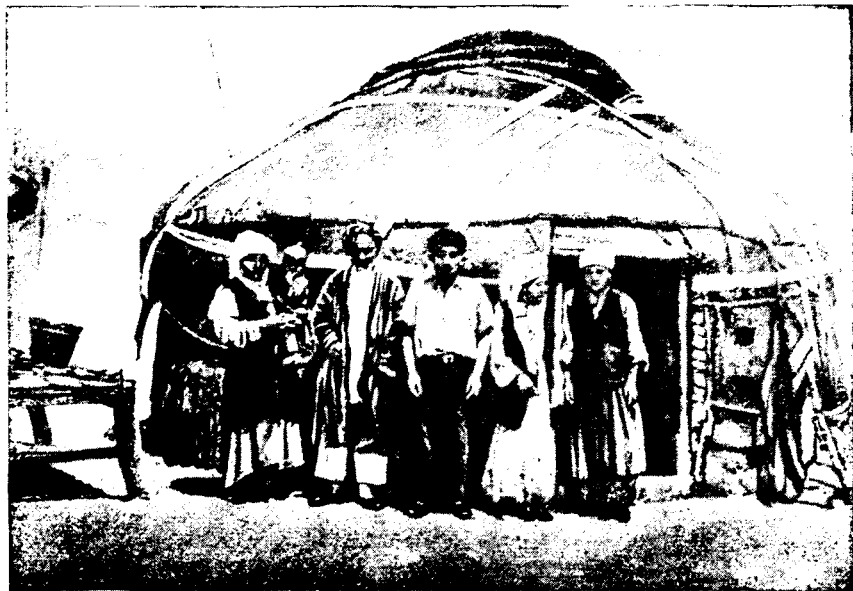
Рис. 3. Кенимехские каракалпаки в одежде современного типа у юрты в с. Жанги-Казган

В наше время живущая в степях группа каракалпаков находится под сильным воздействием казахской культуры. Юрта, играющая в степях еще очень большую роль в качестве летнего жилища скотоводов, у кенимехских каракалпаков того же типа, что и у казахов (рис. 3).