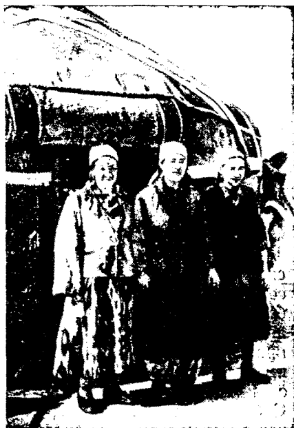
Рис. 4. Каракалпакские женщины из Кенимеха в современной одежде. с. Жанги-Казган