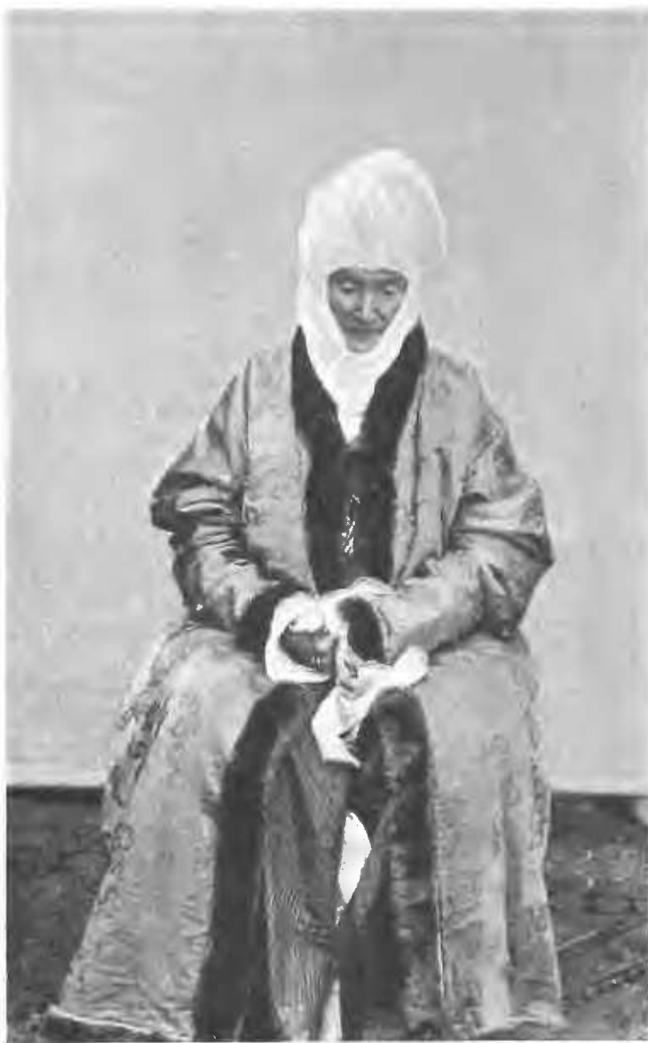
Курбанъ-Джанъ-датха, кара-киргизская царица Алая († 1 февраля 1907 года).