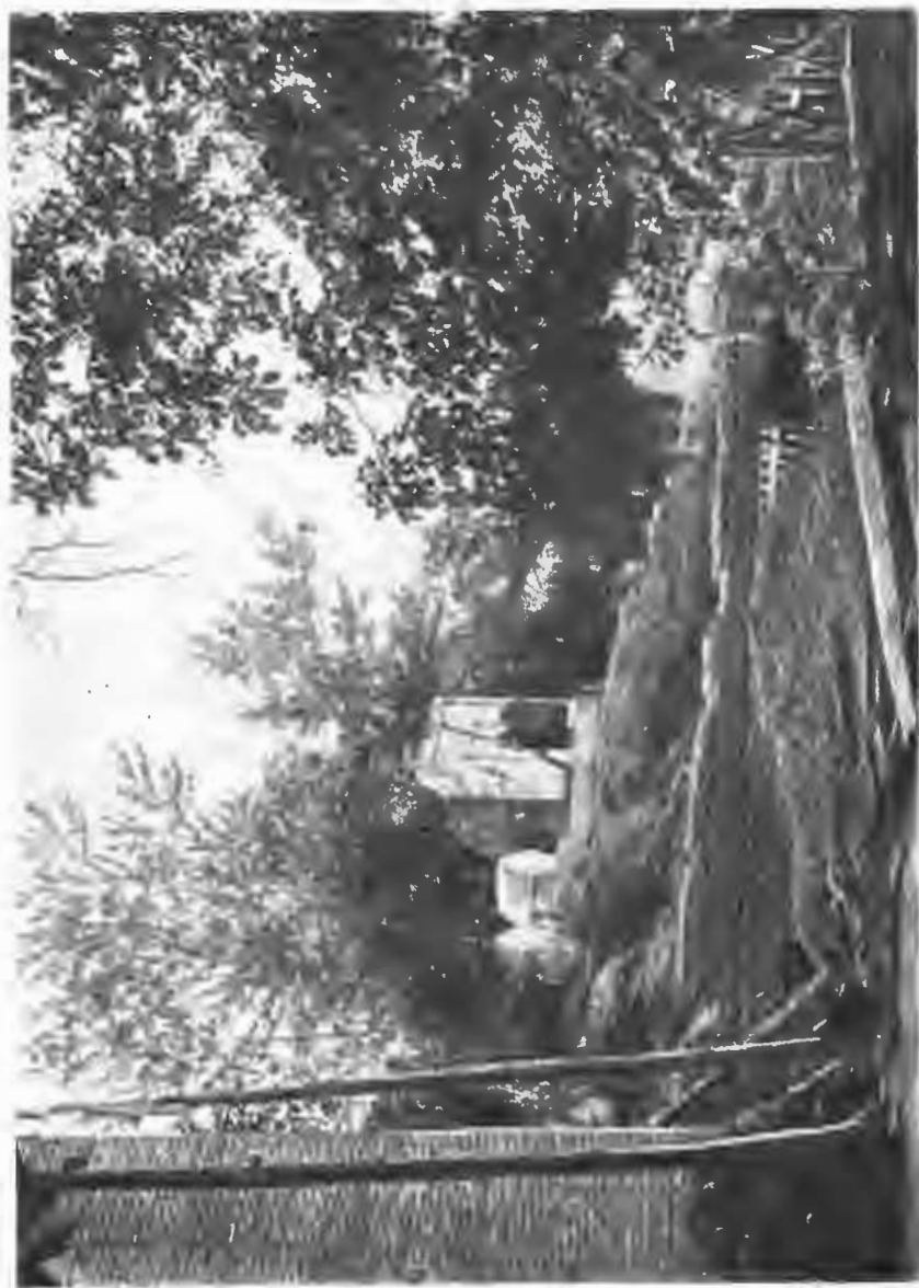
Могила казненного Камчи-бена и мѣсто погребенія его матери, Курбанъ-Джанъ-дагхи.