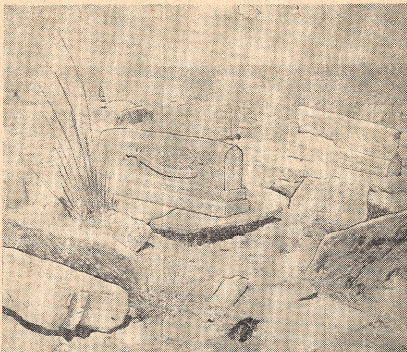
Рис. 1. Надгробные камни на туркменском кладбище XVIII в. (полуостров Мангышлак).

По словам нашего информатора Сарсан-ага, такие светильники здесь имелись раньше в каждом селении. Их зажигали во время молитв и общественных сходов. В юртах для освещения использовались каменные светильники той же фор-