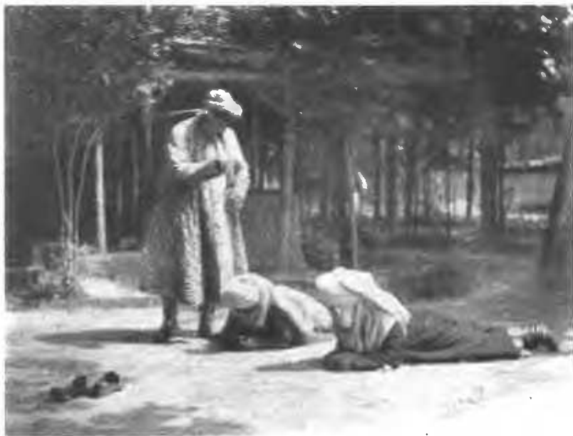
Удары нагайкой по спинѣ двухъ рядомъ лежащихъ киргизокъ.

лежащему боку, перешагиваетъ черезъ него разъ, затѣмъ круто поворачивается, перешагиваетъ снова и, наконецъ, въ третій разъ. Во время каждого перешагиванія сокучь слегка дотрагивается пяткой своей ноги спины пациента. Перешагнувъ три раза черезъ пациента, сокучь останавливается и трижды ударяетъ по спинѣ лежащаго нагайкой, неразлучно находящейся при немъ, послѣ чего сеансъ считается законченнымъ, пациентъ поднимается и платитъ гонораръ за «леченіе». Бѣдняки покупаютъ для его лошади нѣсколько сноповъ люцерны, богатые же одариваютъ сокуча болѣе