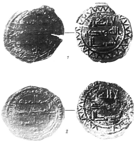
Рис. 1. Фельсы Мухаммада ал-Махди (1, 2).