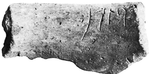
Рис. 3. Фрагмент венчика хума VII—VIII вв. с рунической надписью из Кирил Пилау (Исфара). Археологический кабинет САГУ.