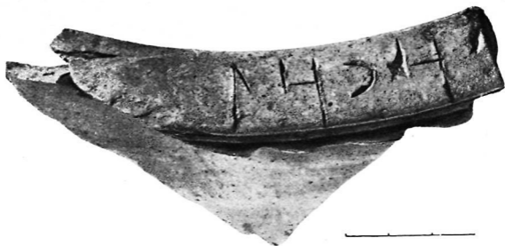
Рис. 2. Фрагмент венчика хума с рунической надписью из Ош-хона (базис Мык-Пошо). Находка 1951 г. Коллекции ПФАЭКЭ.