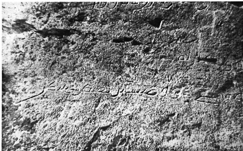
Рис. 5. Фрагмент Варухской надписи уйгурским письмом. Находка 1950 г.