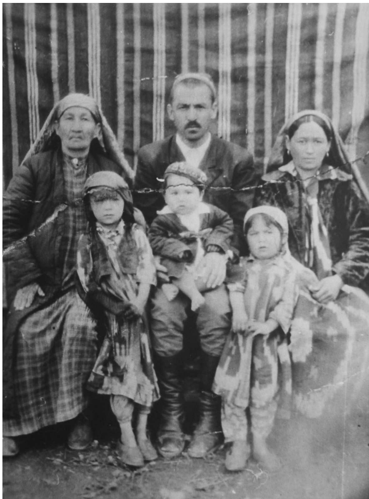
Илл. 7. Вдова Рахманкула с семьей младшего сына