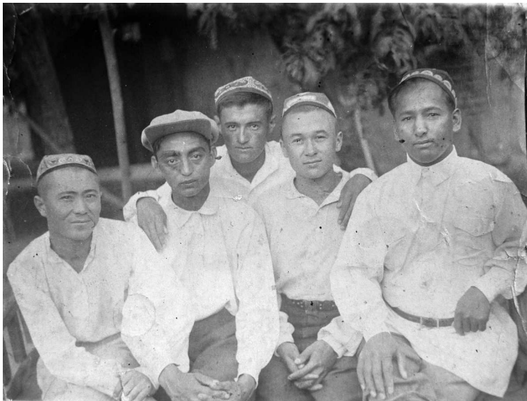
Илл. 14. Учителя из Ошобы

мобильности, все названные мной структурные качества давали шанс для накопления ресурсов и конвертации их во властные полномочия и материальные блага. В 1930—1940-е и в начале 1950-х годов учителя были едва ли не главным резервом для формирования местной советской элиты, включая комсомольские и партийные органы, руководство сельскими и районными советами и колхозами.