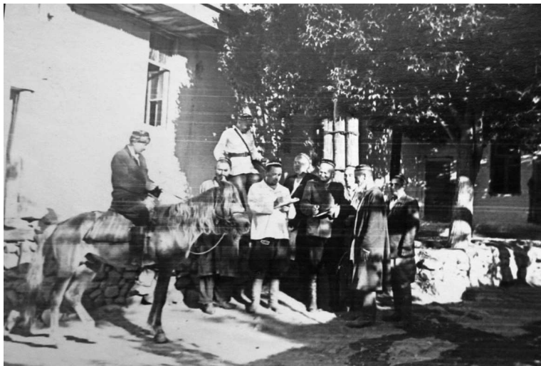
Илл. 13. Советские активисты в кишлаке