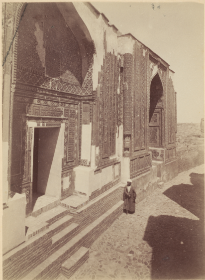
12. Мавзолей на могилѣ Турчанъ-Ана (дочь Эмира Тараганъ) у мечети Шахъ-зинда построень въ 773 году геджры (и. Р. X. 1371 году).