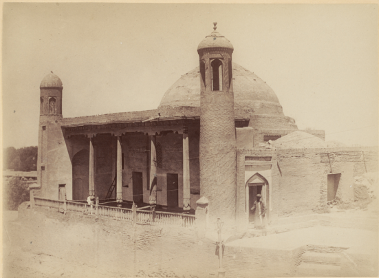
40. Могила Святаго Хазретъ-Хизръ .