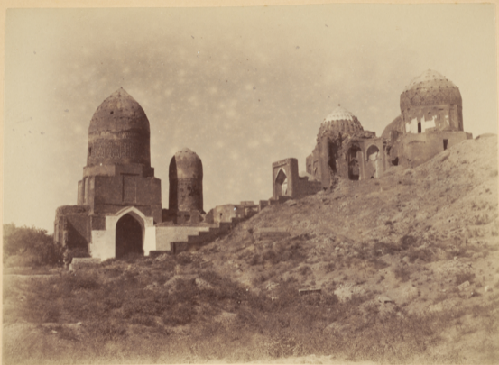
35. Общій видъ мавзолеевъ у мечети Шахъ-Зинда.