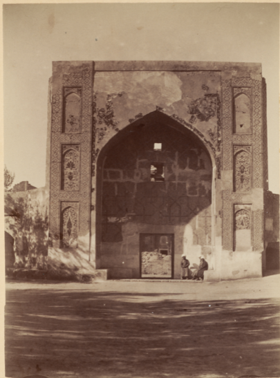
34. Порталь входа въ мадраса Надиръ-диванъ-беги.