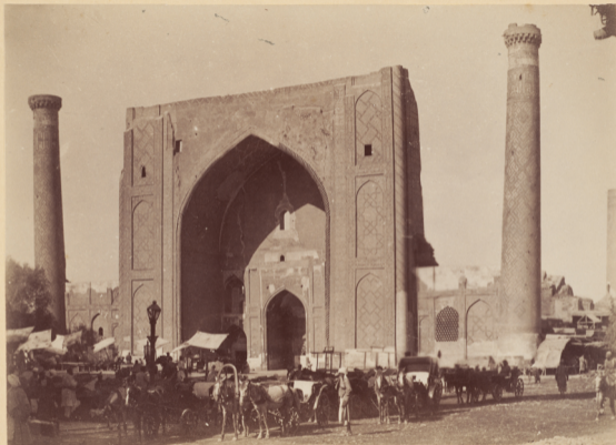
2. Мадраса Улугъ-бекъ построено внукомъ Тамерлана Эмиромъ Мирза-Улугъ-бекомъ въ 823 году геджры (п. Р. X. 1420 году).