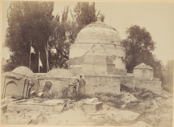
14. Мечеть Ходжа-Абду-дарунъ (Моизитдинъ, сынъ Ходжи-Абду-бюруна) построена у могилы Святаго того-же имени Мирзой-Улугъ-бекомъ въ 845 году геджры (и. Р. X. 1441 году).