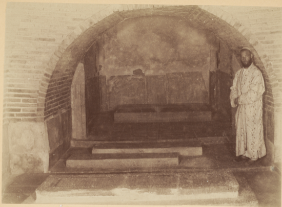
25. Надгробный камень и склепъ въ мавзолей Тамерлана.