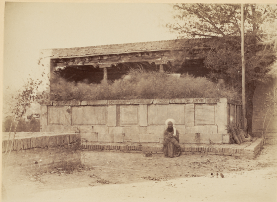
33. Могила Святого Ходжи-Абду-бюруна.