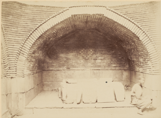
29. Внутренній видъ Мавзолея Биби-Ханымъ