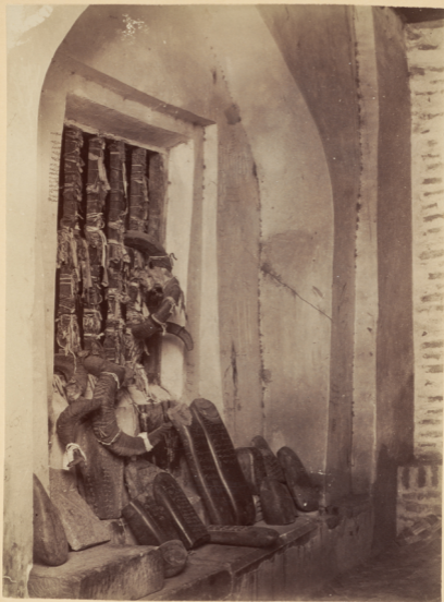
32. Могила Святого Ходжи-Абду-даруна.