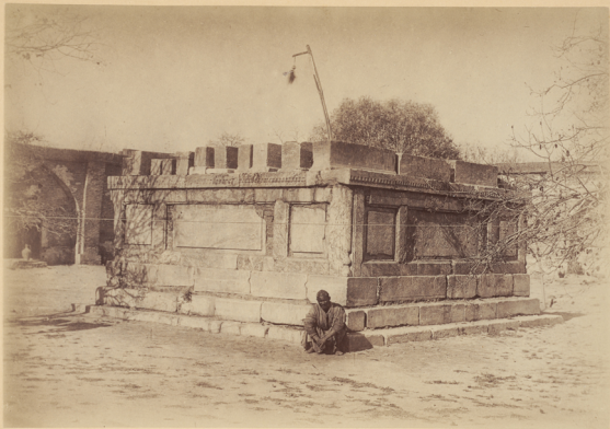
6. Усыпальница 9-ти царствовавших хановъ и ихъ семействъ: Шейбани-хана, умершаго въ 916 году геджры (п. Р. X. 1510 году), сына его Тимурь-Мухаммадь-хана, правнука Нутлукъ-Мухаммадь-Султана и др.