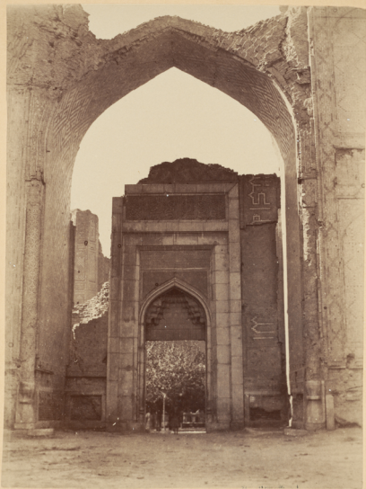
26. Триумфальная арка со стороны базара въ ма- драса Биби-ханьмъ.