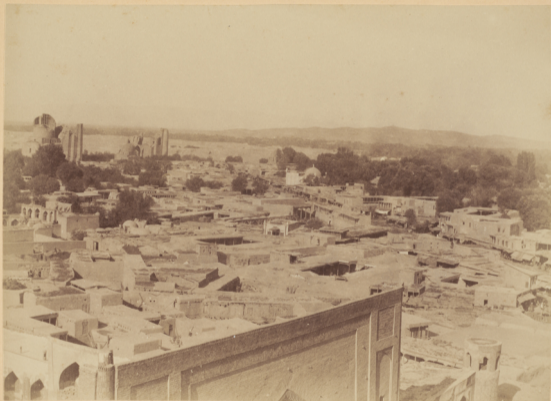
53. Видъ г. Самарканда съ минарета Улугъ-бекъ.