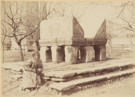
37. Мраморный пюпитръ для корана среди двора въ мадраса Бибі-Ханымъ .