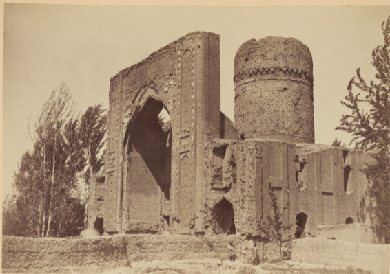
16.. Мавзолей Ишратъ-хана на могилѣ бабушки Тимерлана Сахибъ-Давлять-бена, дочери Эмира-Джалолуджина.