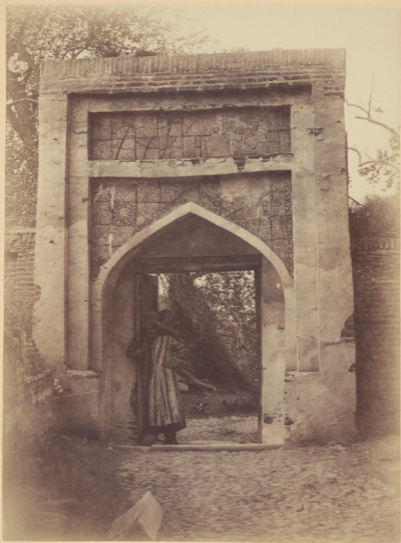
48. Порталъ входа на могилу Магзуми-Агзамъ .