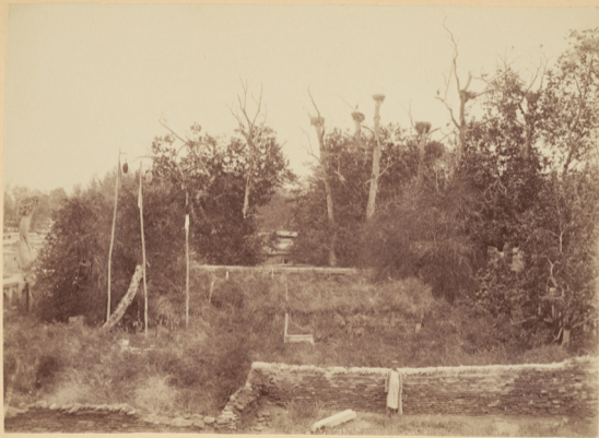
47. Могила Святого Магзуми-Агзамъ , умершаго въ 949 году геджры (и Р. Х. 1542 году).