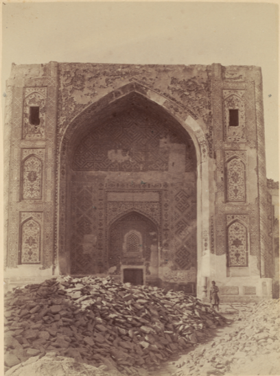
17. Мадраса Надиръ-Мухамадъ-диванъ-беги построена у могилы Святаго Ходжи-Ахрара въ 1048 геджры (п. Р. X. 1638 году).