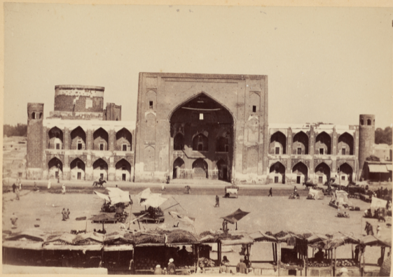
3. Мадраса Тилля-кари (тилля—золото, кяръ—дѣлать) построена Эмиромъ Ялангушъ-Бага- дуромъ въ 1051 году геджры (п. Р. X. 1641 году).