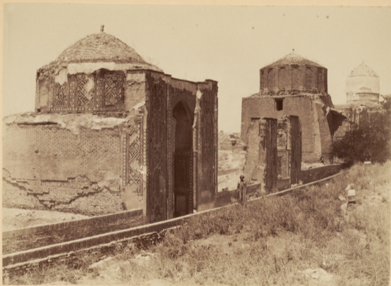
28. Мавзолей надъ могилами: Туманъ-Ана (жены Тимурлана) построена въ 762 году геджры (п. Р. X. 1361 году) и два другихъ мавзолея, время постройки которыхъ и имена погребенныхъ неизвестны.