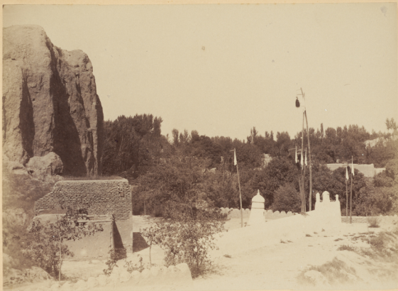
20. Могила Святаго Ходжи-Даніяра, сподвижника Кусамы-Ибизъ-Абаса, умершаго въ 56 году геджры (п. Р. Х. 677 году).