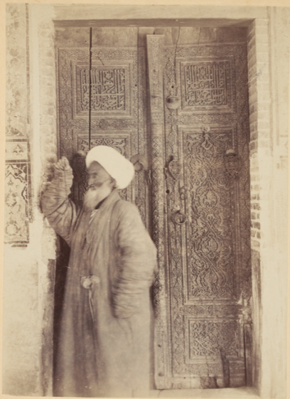
36. Дверь, ведущая въ мавзолей Кусамъ-Ибнъ-Абаса.