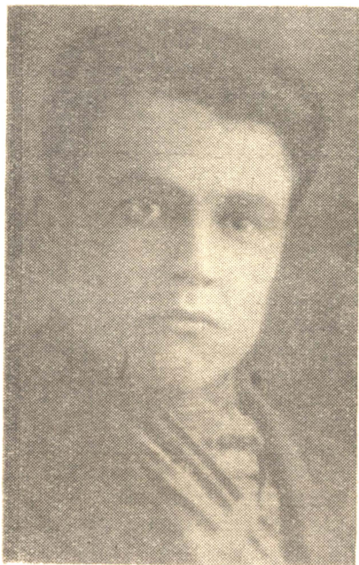
Алексей Илларионович Иваницын

Следует отметить, что общение с представителями русского пролетариата и социал-демократами, среди которых были такие опытные и закаленные революционеры, как А. И. Иваницын, безусловно, оказало большое прогрессивное влияние на классовое и политическое самосознание рабочих из коренного населения, а также на трудовых дехкан.