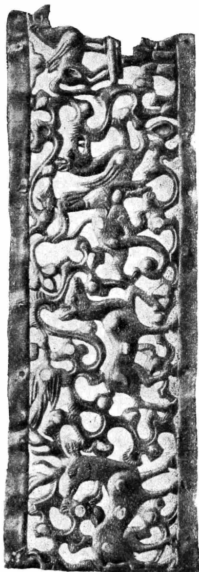
Рис. 2. Золотая диадема из погребения на р. Карагалинке.