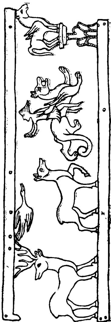
Рис. 2а. Прорисовка изображений на двадце из погребения на р. Карагалинке;