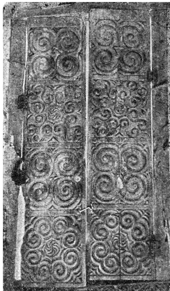
Рис. 5. Резьба по дереву.