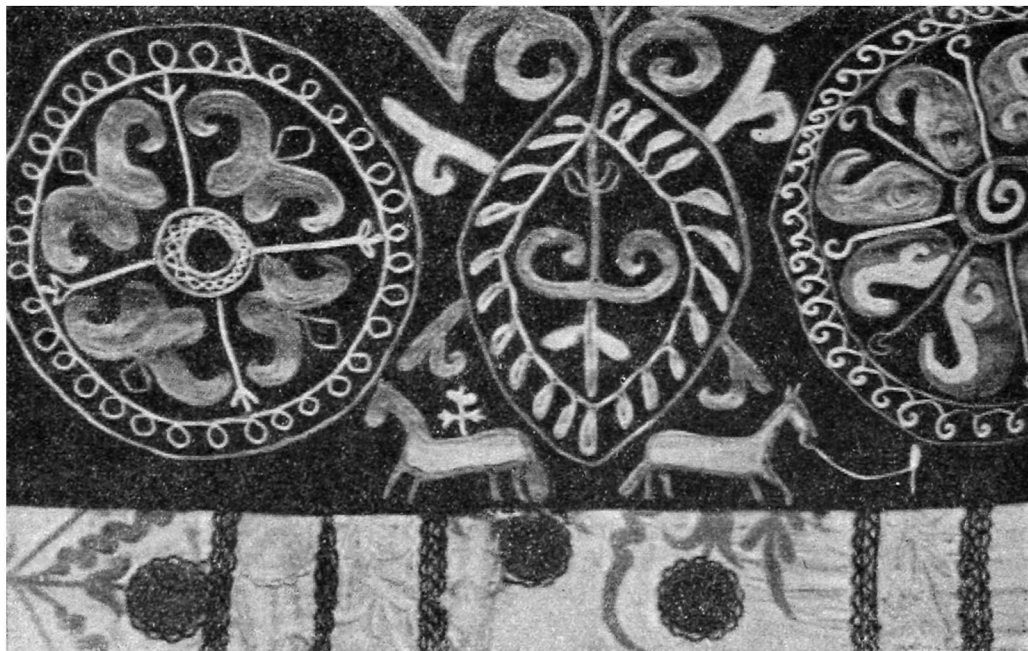
Рис. 2. Вышивка на кошме.

Исключительную художественную ценность имеют тканые ворсо-