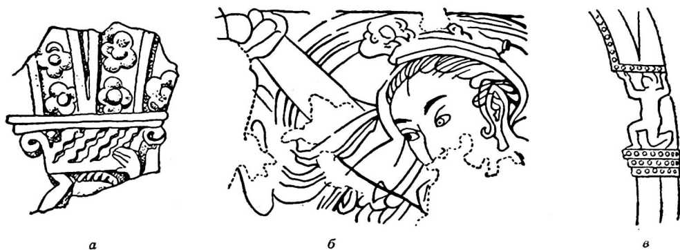
Рис. 1. Кариатиды в изобразительном и прикладном искусстве Средней Азии: а) рельеф на оссуарии из Бия-Наймана; б) в настенной живописи Варакши; в) рельеф серебряного сосуда из коллекции Государственного Эрмитажа.

Кариатиды, как и другие виды монументальной скульптуры, существовали до ислама в Средней Азии. Об этом свидетельствуют письменные источники (Ибн ал-Факих, Ахмед ат-Туси), где говорится о некоей мервской постройке, крыша которой опиралась на четыре фигуры — две женские и две мужские 1 . Это же доказывают памятники прикладного искусства, рельефы биянайманского оссуария и серебряного сосуда, отмеченные в свое время А. Я. Борисовым 2 (рис. 1).