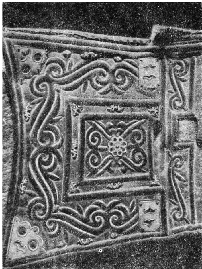
Рис. 4. Плотник