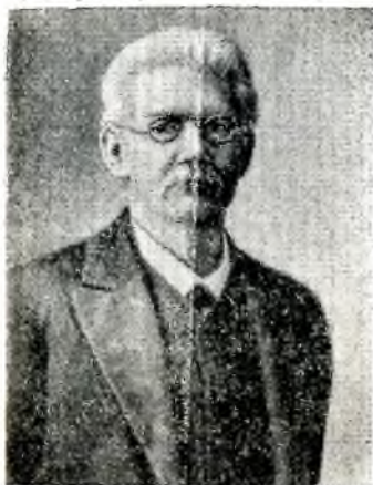
ВАСИЛИЙ ВАСИЛЬЕВИЧ РАДЛОВ

ВЫДАЮЩИЙСЯ востоковед-тюрколог (языковед, фольклорист, этнограф, историк, археолог) В. В. Радлов родился 5 января 1837 в Берлине. В Берлинском и Галльском университетах (в последнем он был слушателем двух семестров) Радлов имел возможность слушать лекции крупнейших языковедов, под влиянием которых у него окрепло стремление к глубокому изучению восточных языков, в частности тунгусских наречий.