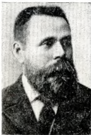
НИКОЛАИ ИВАНОВИЧ ВЕСЕЛОВСКИЙ

Н. И. ВЕСЕЛОВСКИЙ — видный представитель отечественной школы истории восточных стран, основание которой связано с учреждением в 1863 кафедры истории Востока на факультете восточных языков Петербургского университета, — родился 12 ноября 1848 в Москве. В 1867 окончил гимназию в Вологде. В 1869 был зачислен слушателем факультета восточных языков Петербургского университета по арабско-турецкому разряду, где являлся ближайшим учеником В. В. Григорьева (см.) В первую очередь именно Григорьеву Веселовский обязан своим интересом к изучению исторического прошлого Средней Азии.