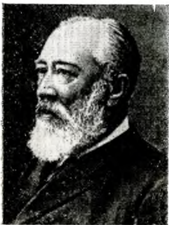
ВЛАДИМИР ВЛАДИМИРОВИЧ ВЕЛЬЯМИНОВ-ЗЕРНОВ

ОДИН из крупнейших востоковедов второй половины XIX — начала XX в. В. В. Вельяминов-Зернов родился 31 октября 1830 в Петербурге, окончил в 1850 Александровский лицей, где изучал арабский и персидский языки. Биографы Вельяминова-Зернова высказывают предположение, что изучением восточных языков он был обязан влиянию двоюродного брата Н. В. Ханыкова (см.). В 1850 Вельяминов-Зернов поступил на службу в Азиатский департамент Министерства иностранных дел и в следующем году был откомандирован в Оренбург в распоряжение В. А. Перовского. Здесь он начал практически знакомиться с местными языками, совершал поездки в глубь степей и «усердно изучал их обитателей, знакомился с их бытом при непосредственных сношениях и их историей по архивным делам». В Оренбурге он сблизился с В. В. Григорьевым (см.), пользовался его советами и поддержкой и «называл его совсем по-родственному — отцом».