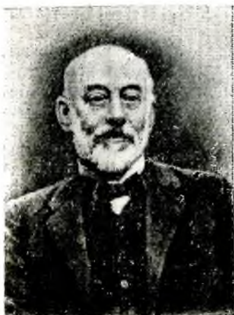
КАРЛ ГЕРМАНОВИЧ ЗАЛЕМАН

КРУПНЫЙ востоковед-ученый и организатор науки К. Г. Залеман родился в Ревеле (Таллине) 28 декабря 1849. По получении среднего образования (1867) поступил на факультет восточных языков Петербургского университета, где специализировался по персидскому языку. Окончив университет в 1871, занимался под руководством П. И. Лерха ( см. ) иранскими наречиями и в 1873 получил степень магистра персидской словесности. С 1875 стал читать в университете лекции по «зандскому» и среднеперсидскому (пехлеви́скому) языкам.