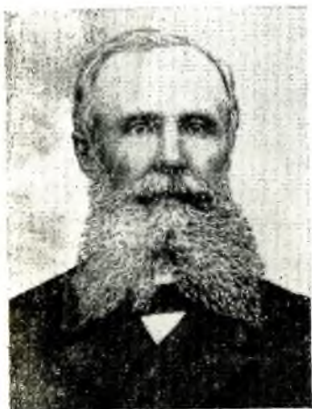
ВЛАДИМИР ПЕТРОВИЧ НАЛИВКИН

ЗНАТОК истории, жизни и быта узбекского народа В. П. Наливкин родился 15 июля 1852 в Калуге. Историографически Наливкин — яркая, социально сложная и противоречивая фигура. Прогрессивность его убеждений до 1917 стоит вне сомнений.