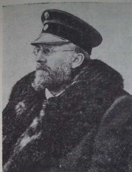
НИКОЛАЙ ФЕДОРОВИЧ ПЕТРОВСКИЙ

ИЗВЕСТНЫЙ знаток Туркестана и собиратель восточных древностей Н. Ф. Петровский родился 30 ноября 1837, окончил 2-й Московский кадетский корпус, служил недолго в чине поручика в Астраханском гренадерском полку, был прикомандирован в 1859 к Александринскому сиротскому кадетскому корпусу в должности репетитора русского языка. 9 января 1861 вышел в отставку «по домашним обстоятельствам», а в действительности «в связи с обвинением... в числе других лиц, в противозаконных сношениях с лондонскими политическими изгнанниками». Решением Сената было определено «отставного штабс-капитана Петровского за недонесение о пребывании в Москве неосужденного государственного преступника Кельсиева... с знанием о преступных его замыслах, признать подлежащим заключению в крепости на один год». Впоследствии ему был зачтен срок «содержания в крепости во время производства... дела».