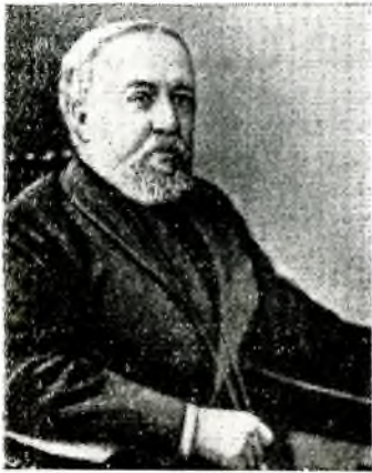
ВИКТОР РОМАНОВИЧ РОЗЕН

ОБЩЕПРИЗНАННЫЙ «основатель новой школы русского востоковедения» (И. Ю. Крачковский) конца XIX— начала XX в., ближайший учитель и наставник В. В. Бартольда (см.), А. Э. Шмидта (см.) и других крупных востоковедов, В. Р. Розен родился в 1849. По окончании Таллинской (Ревельской) гимназии поступил в 1866 на факультет восточных языков Петербургского университета. В 1870 окончил факультет по арабско-персидско-турецко-татарскому разряду и за сочинение «Полная оценка «Шах-намэ» удостоен золотой медали. В 1872 защитил диссертацию на степень магистра арабской словесности по теме «Древнеарабская поэзия и ее критика» и в том же году был избран доцентом по кафедре арабской словесности. С 1879 по 1882 был адъюнктом Академии наук, когда сложил с себя это звание будучи несогласным с порядками, установленными тогда в Академии наук ее незыблемым секретарем и его окружением, придерживавшихся старых традиций в борьбе с приверженцами нового, буржуазно-либерального направления.