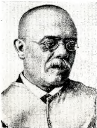
САМУИЛ МАРТЫНОВИЧ ДУДИН

ХУДОЖНИК, путешественник, этнограф и археолог, музейный работник С. М. Дудин родился 19 августа 1863 в местечке Ровном Елисаветградского уезда Херсонской губернии, в семье сельского учителя,