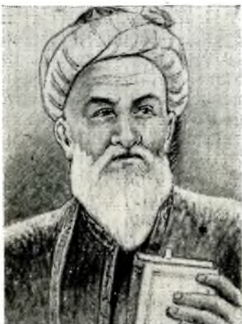
АБУ АЛИ ИБН СИНА

ВСЕМИРНО-известный ученый, гениальный мыслитель средних веков Абу Али ал-Хусейн ибн Абдаллах ибн ал-Хасан ибн Али Сина, известный на Западе под именем Авиценны (от древнееврейского написания Авен-Сина), родился предположительно в 370/980 в Афшане (близ Бухары).