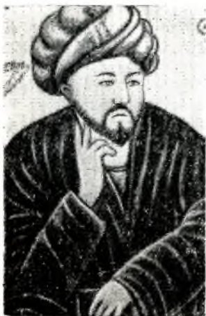
АБУ НАСР ФАРАБИ

ВЫДАЮЩИЙСЯ среднеазиатский мыслитель Абу Наср Мухаммад ибн Мухаммад ибн Узлуг ибн Тархан Фараби родился в 260/873—874* в местности Фараб при впадении Арыси в Сырдарью (по одним данным, в небольшом укрепленном селении Весидж, по другим — в главном городе фарабской округи — Кедере или селении под названием Фараби).