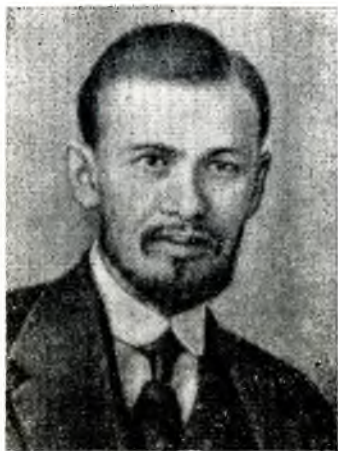
ЕВГЕНИЙ ДМИТРИЕВИЧ ПОЛИВАНОВ

ВЫДАЮЩИЙСЯ лингвист Е. Д. Поливанов родился 28 февраля 1891 в Смоленске в семье служащего. Близкими семье Поливановых людьми были известный педагог В. П. Вахтеров и видный ученый профессор Н. И. Кареев.