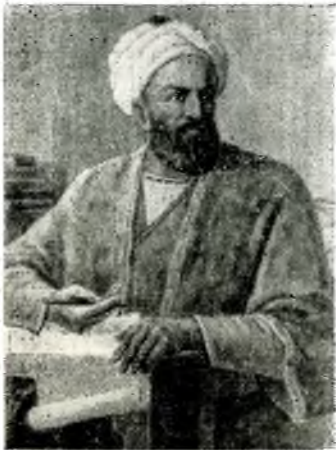
АБУ РАЙХАН БЕРУНИ

ВЫДАЮЩИЙСЯ ученый-энциклопедист эпохи средних веков Абу Райхан Мухаммад ибн Ахмад Беруни (Бируни) родился 2 зу-л-хиджжа 362/4 сентября 973 в г. Кят* — крупном политическом и торгово-экономическом центре Хорезма — области, входившей в состав государства саманидов и в то же время пользовавшейся относительной самостоятельностью. Уместно заметить, что как уроженец Хорезма Беруни всю жизнь оставался патриотом своей страны. Его творчество как бы продолжало и обогащало традиции науки и культуры древнего Хорезма.