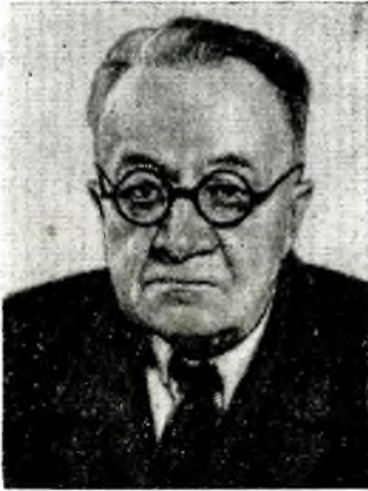
ГЛЕБ НИКАНОРОВИЧ ЧЕРДАНЦЕВ

ИЗВЕСТНЫЙ экономист и историк народного хозяйства Узбекистана Черданцев родился 23 июля (4 августа) 1885 в Омске в семье выходца из крестьян, присяжного поверенного.