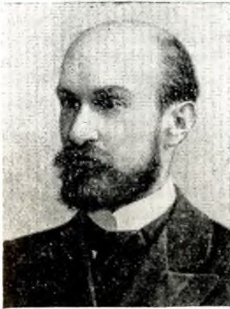
ВАСИЛИИ ВЛАДИМИРОВИЧ БАРТОЛЬД

В. В. БАРТОЛЬД родился 3 (15) ноября 1869 в Петербурге, в буржуазной семье. Окончив с золотой медалью гимназию, осенью 1887 поступил в Петербургский университет на факультет восточных языков по арабско-турецко-татарскому разряду, где ему довелось слушать лекции видных русских востоковедов — Н. И. Веселовского, В. А. Жуковского, К. П. Патканова, В. Д. Смирнова, В. Р. Розена и др. В университете интересы Бартольда сосредоточились на средневековой истории народов стран Ближнего и Среднего Востока. Ближайшим учителем его был академик В. Р. Розен (см.). В 1889 Бартольд был награжден восточным факультетом Петербургского университета серебряной медалью за сочинение «О христианстве в Средней Азии», написанное в связи с находками сирийско-несторианских надписей на территории Семиречья. В 1891 Бартольд окончил университет с дипломом первой степени и по совету Розена совершил в том же году заграничную поездку для совершенствования своих знаний и для научных занятий. Уже тогда им владела мысль о необходимости заняться глубоким изучением источников по Средней Азии для составления критической истории этой обширной территории.