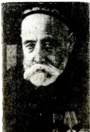
· САДРИДДИН АЙНИ

ИЗВЕСТНЫЙ писатель, ученый и общественный деятель Садриддин Саид-Муродзода (с 1896 псевдоним «Айни») родился 15 (27) апреля 1878 в кишлаке Соктари Гиждуванского тюмена Бухарского эмирата (близ г. Гиждувана).