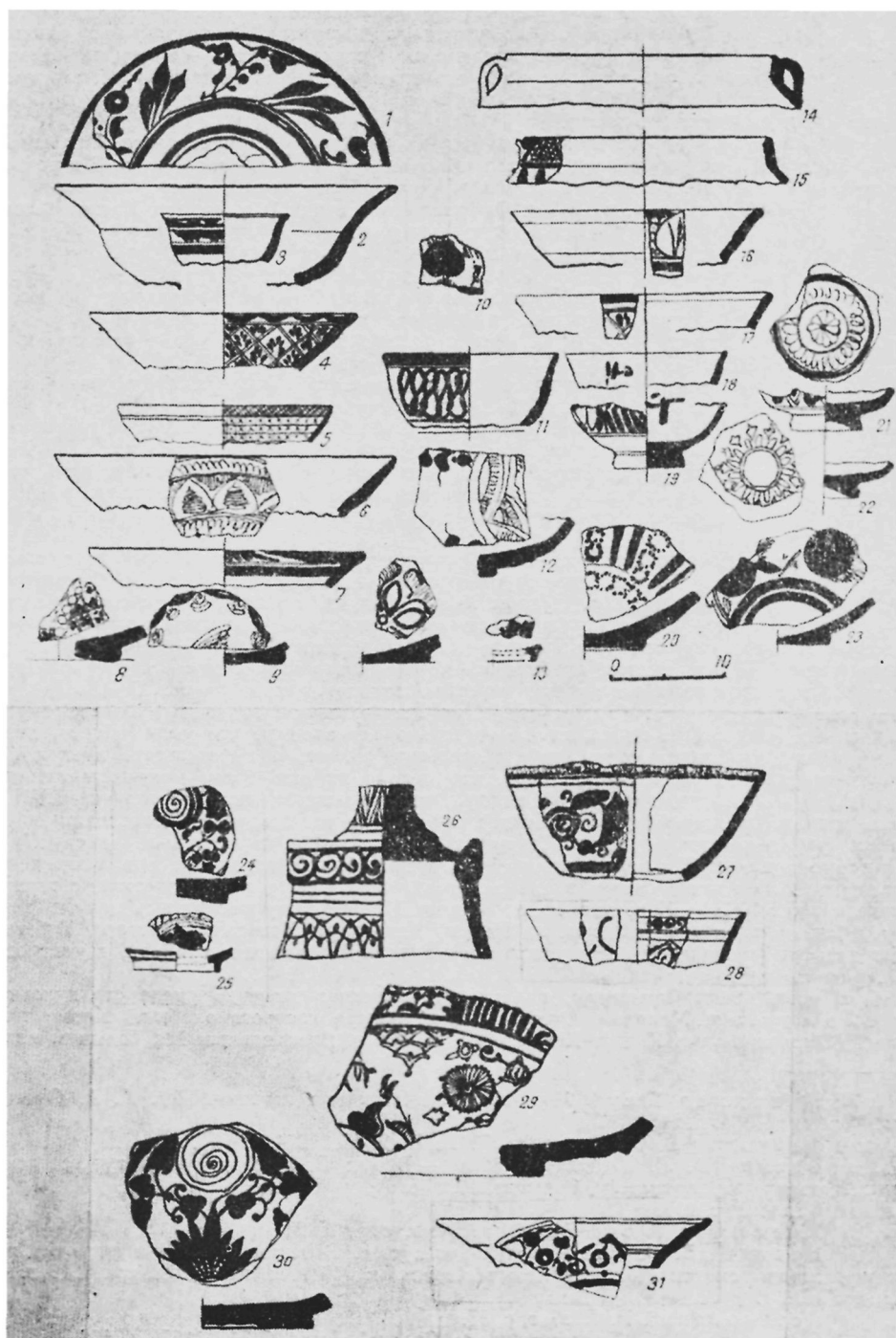
Рис. 2. Образцы керамики из Дагбита.

Здесь следует напомнить, что еще со времени Тимура наряду с официальным мусульманским духовенством развиваются различные суфийские ордена, среди кото-