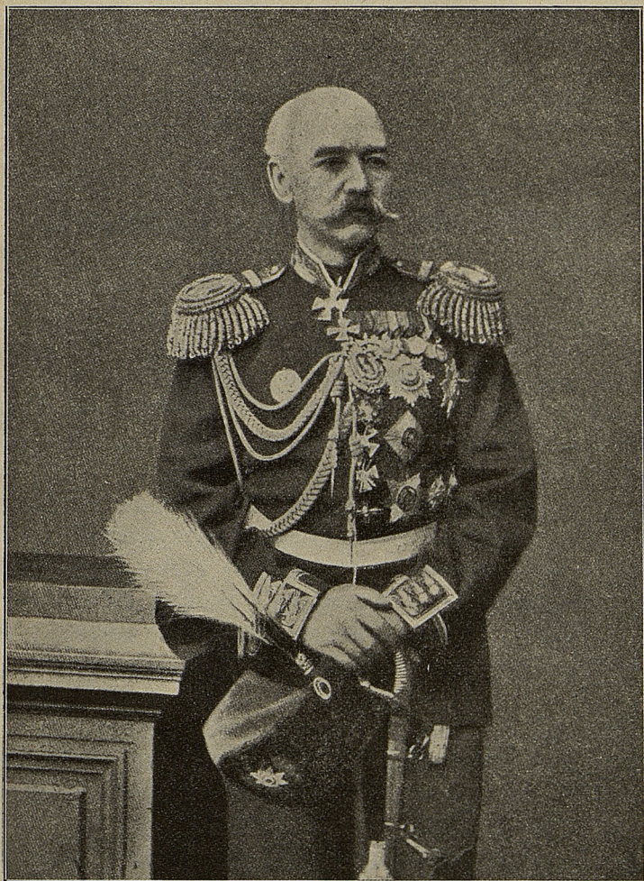
ТУРКЕСТАНСКІЙ ГЕНЕРАЛЬ-ГУБЕРНАТОРЪ КОНСТАНТИНЪ ПЕТРОВИЧЪ ФОНЪ-КАУФМАНЪ.