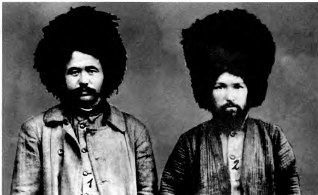
1) Абделькадир Инан, 2) Заки Валиди Тоган в туркменской одежде, январь 1923 г.