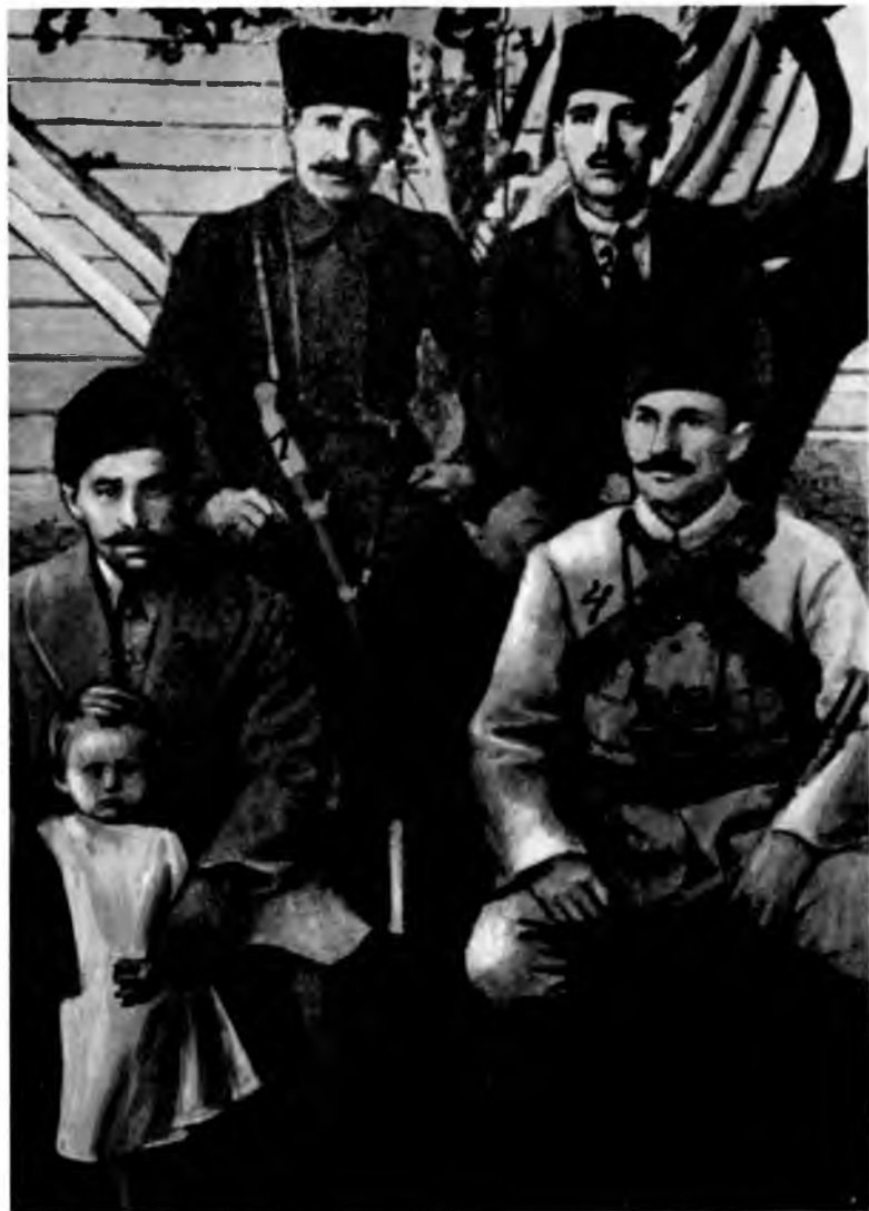
Турецкие офицеры, входившие в свиту Энвера паши: 1) Али Риза, 2) Баргинли Мухитдин, 3) полковник Хасан, 4) полковник Халил.