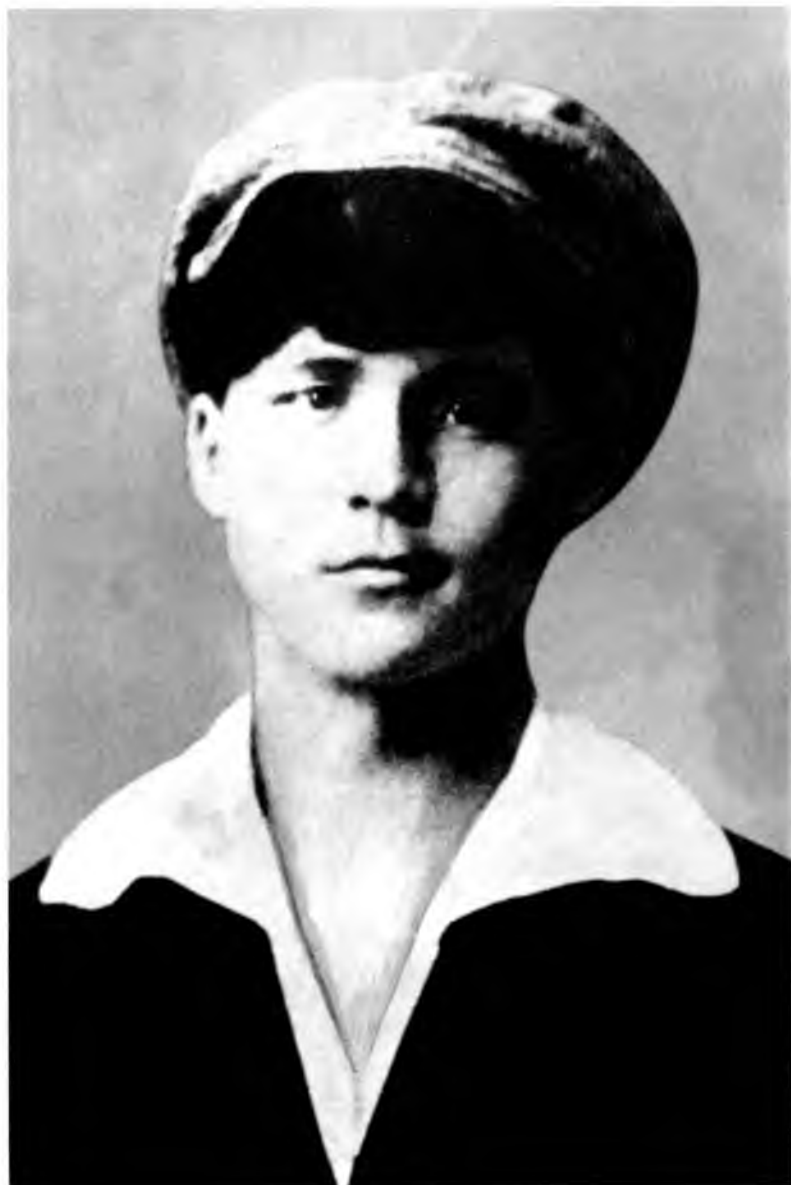
Казахский поэт и артист Динше, представлявший Алаш Орду в Бухаре и Самарканде.