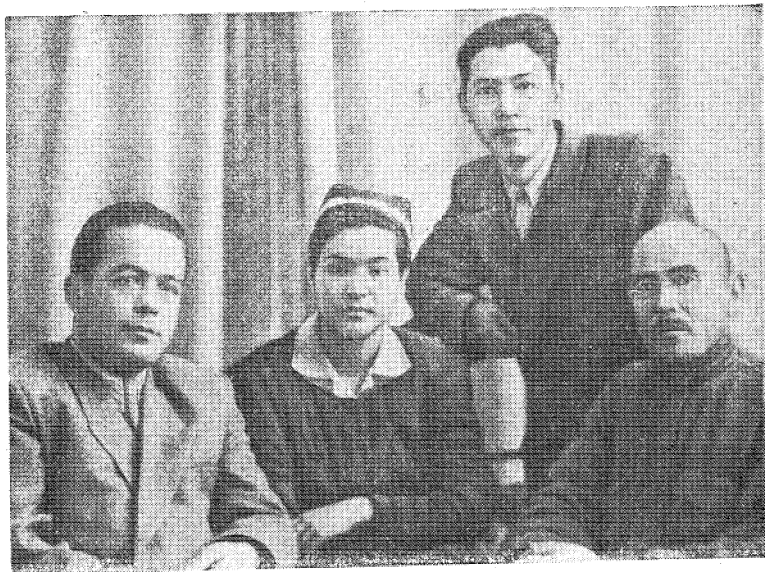
Автор (слева) среди потомков бухарцев в Сибири (1957 г.).

Бухарцы благодаря своему трудолюбию и честности пользовались большим авторитетом и уважением в Рос-