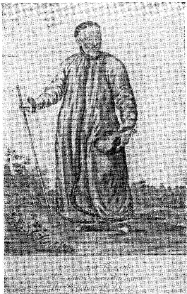
Бухарец в Сибири (XVIII в.).