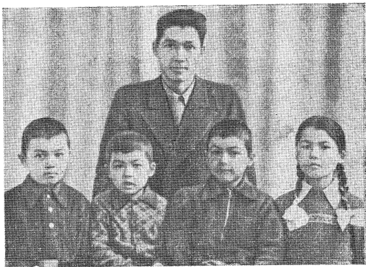
Потомки бухарцев в Тобольске (1957 г.).

Бухарцы и ташкентцы в течение длительного времени сохраняли вековые среднеазиатские обычаи и обряды.