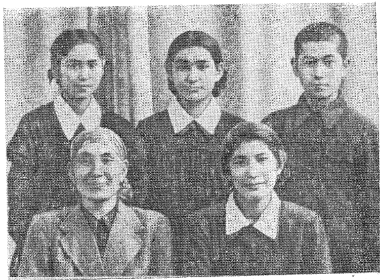
Потомки бухарцев в Тюмени (1957 г.).

Общение с русским населением сыграло большую