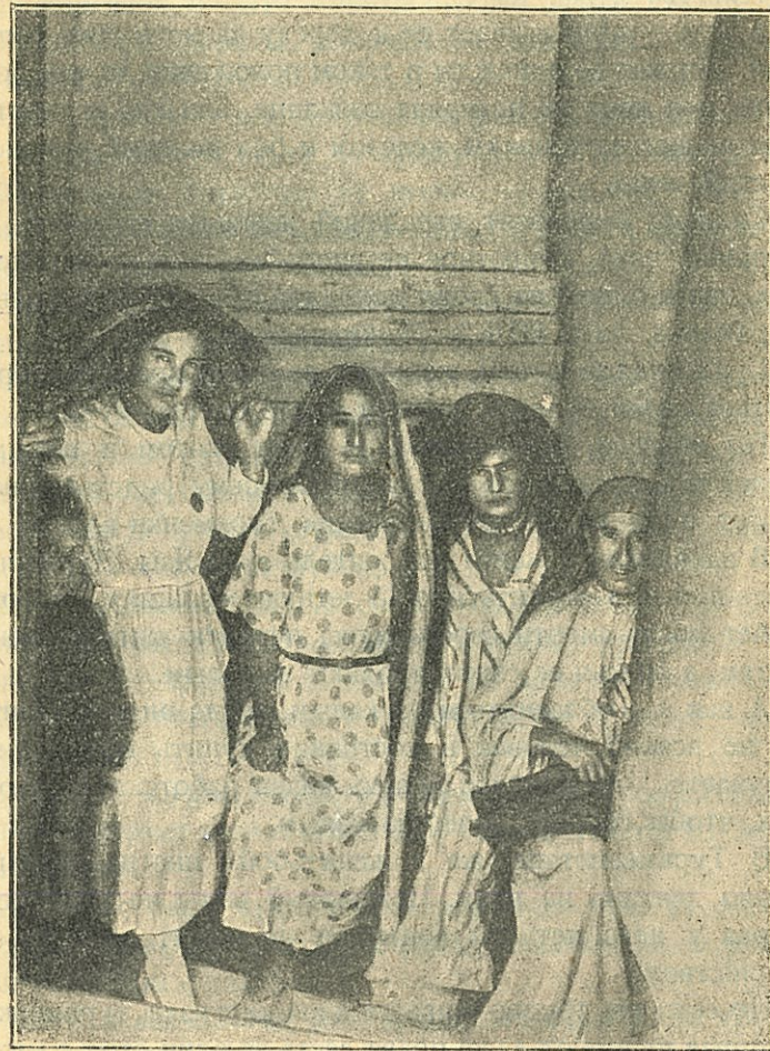
При входе в женский клуб.

До чего зачастую доходит издевательство над женщиной, показывает одно из заявлений в Мервский женотдел от гражданина Солтан-Карахан-Оглы, в ко-