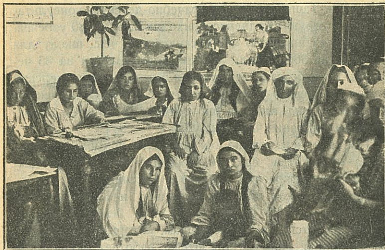
Библиотека при женском клубе в Ташкенте.

В женском клубе она может открыть свое лицо, при-