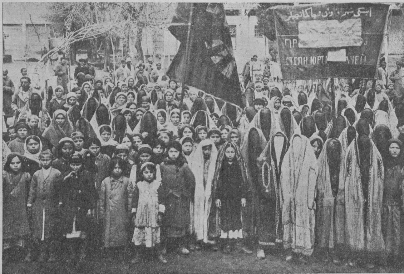
Манифестация 8-го марта туркестанских женщин.