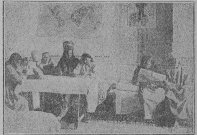
В общежитии курсов волостных организаторов по работе среди декханок.

Первые курсы волорганов влили еще маленький отряд в армию женотдельских работников по Туркестану.