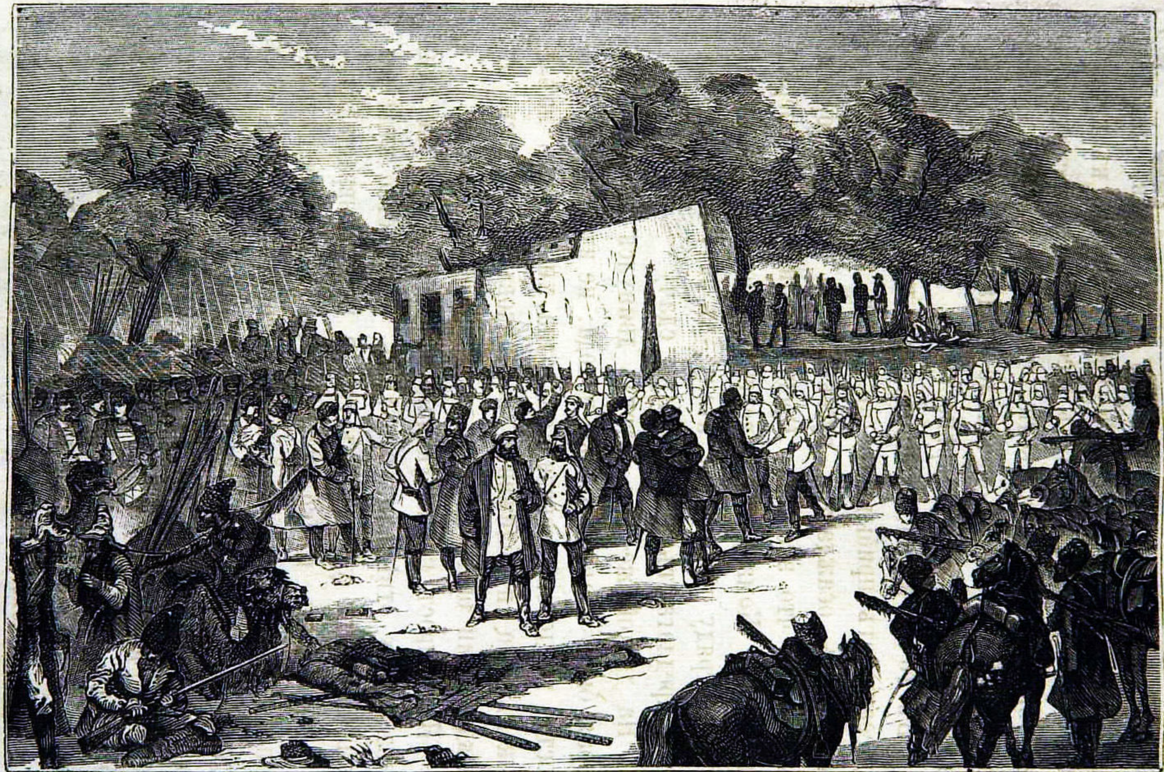
Встрѣча Туркестанскаго и Оренбургскаго отрядовъ.