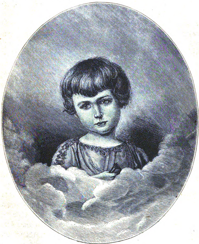
Скобелевъ въ дѣтствѣ.

ревнѣ катался иногда съ нею верхомъ. Однажды въ присутствіи ея гувернеръ ударилъ его по лицу. Скобе-