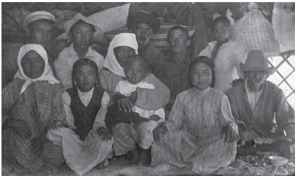
Рис. 5. Смешанная группа в юрте. Негатив, фотоотпечаток. Киргизы. Семиреченская область, Нарынский район. Н. П. Дыренкова, И. Д. Старынкевич. 1926 г. МАЭ № 3661-28

Однако, судя по фотографиям, к концу 20-х годов XX в. элечек у северных киргизов вытесняется из повседневной жизни платком пестрой и однотонной расцветки (МАЭ № 3661-28), часто фабричного российского производства, тюрбан становится обрядовым и праздничным головным убором женщин среднего и преклонного возраста (МАЭ № 3661-25; рис. 4). Опять же, отталкиваясь от фотографий, можно выделить два способа повязывания платка — под подбородком и на затылке (МАЭ № 3793-50, 3661-3, 3661-20, 3661-28 (рис. 5), 3793-105 (рис. 6), 3661-19). Через несколько десятилетий элечек как тип голов-