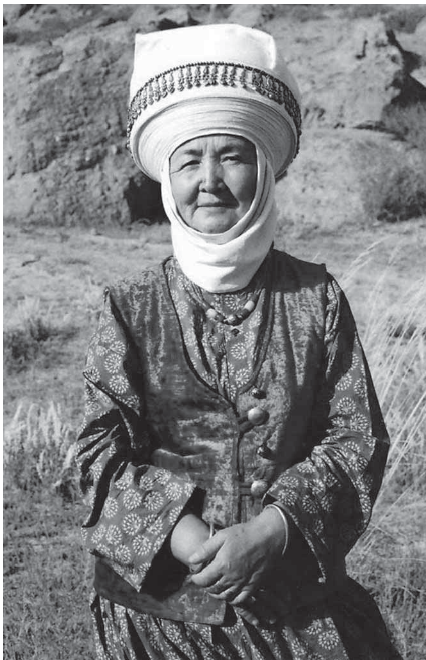
Рис. 16. Женщина в традиционном костюме элечек , характерном для северного варианта киргизской культуры. Фотоотпечаток. Киргизы. Иссык-Кульская область. И. В. Стасевич. 2016 г.

айылы». Участники в течение всего сезона носили традиционные костюмы, постигали знания традиционного киргизского быта, обучались ремеслам, правилам ухода за скотом и приготовления традиционной пищи.