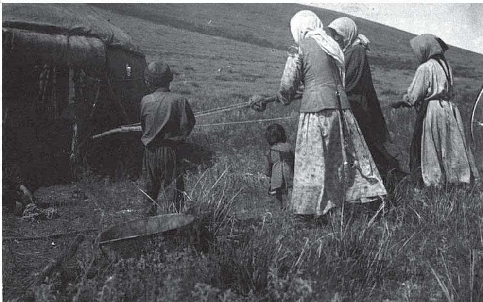
Рис. 6. Киргизки вьют шерстяную веревку. Негатив, фотоотпечаток. Киргизы. Киргизская автономная область. К. К. Юдахин. К. 1928 г. МАЭ № 3793-105

ного убора, по крайней мере в Прииссыккулье, практически выйдет из употребления, праздничным головным убором станет шелковый фабричный платок или белая вязаная шаль с бахромой (Абрамзон и др. 1958: 182). Вязание на спицах и крючком, как и вышивку крестом, киргизские женщины переймут у русских переселенцев.