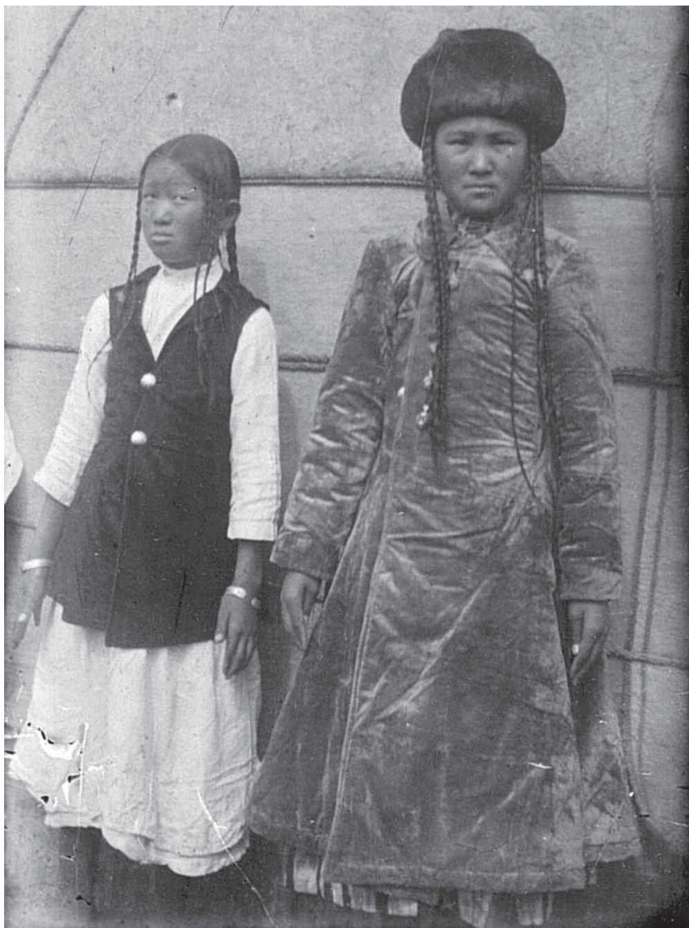
Рис. 8. Две девочки. Одна в праздничной одежде, другая в домашней. Негатив, фотоотпечаток. Киргизы. Семиреченская область, Нарынский район. Н. П. Дыренкова, И. Д. Старынкевич. 1926 г. МАЭ № 3661-46

тюме все еще сохраняются предметы, характерные именно для кочевого быта, удобные и практичные в повседневной носке. На нескольких фотографиях К. К. Юдахина мы видим распашную набедренную одежду бельдемчи , являющуюся частью костюма замужних женщин (МАЭ № 3793-28 (рис. 10), 3793-52,