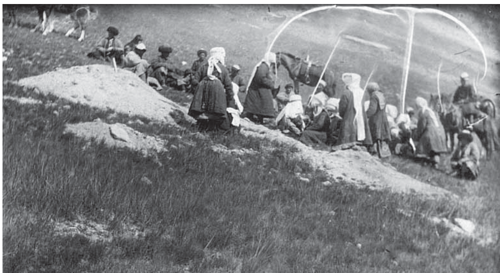
Рис. 2. Поминки на кладбище близ местности Тат-Рабат. Негатив, фотоотпечаток. Киргизы. Семиреченская область, Нарынский район. Н. П. Дыренкова, И. Д. Старынкевич. 1926 г. МАЭ № 3661-34