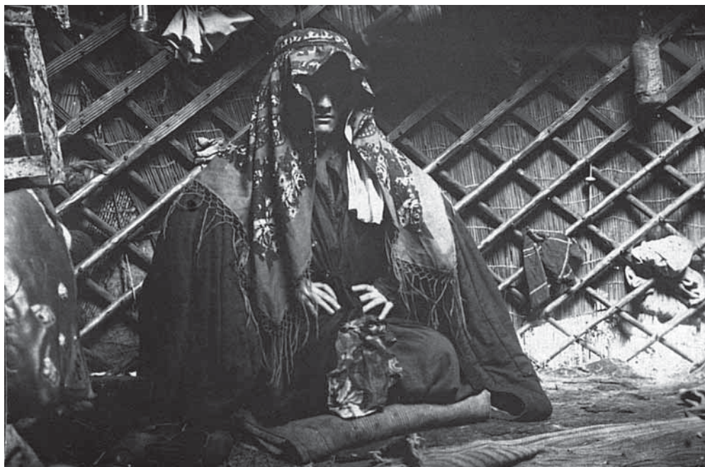
Рис. 11. Киргизка оплакивает мужа. Траурный костюм «тул». Негатив, фотоотпечаток. Киргизы. Киргизская автономная область. К. К. Юдахин. 1928 г. МАЭ № 3793-78

преклонного возраста, причем шить бельдемчи будут из темной ткани и без вышивки (Абрамзон и др. 1958: 179). На имеющихся у нас фотографиях мы видим великолепно декорированные вышивкой образцы распашной юбки, характерной именно для северного варианта женского костюма. Такую юбку шили из трех скошенных клиньев, пришитых сборками к широкому твердому поясу, и богато украшали традиционной вышивкой.