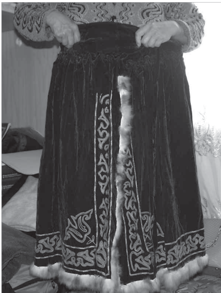
Рис. 13. Современная распашная юбка бельдемчи . Фотоотпечаток. Киргизы. Таласская область. И. В. Стасевич. 2013 г.

Не будем забывать, что отличия в костюмном комплексе зависят и от места проживания женщин. Несомненно, тяга к ношению элементов традиционного костюма заметно выше у сельских жительниц среднего и пожилого возраста.