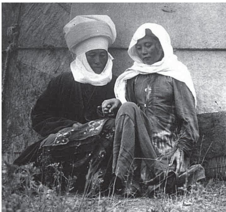
Рис. 1. Головной убор замужней женщины-киргизки. Негатив, фотоотпечаток. Киргизы. Киргизская автономная область. К. К. Юдахин. 1928 г. МАЭ № 3793-39

Из обуви киргизские женщины предпочитали сапоги өтүк , мягкие сапожки маасы , галоши кепич ( көлөш ).