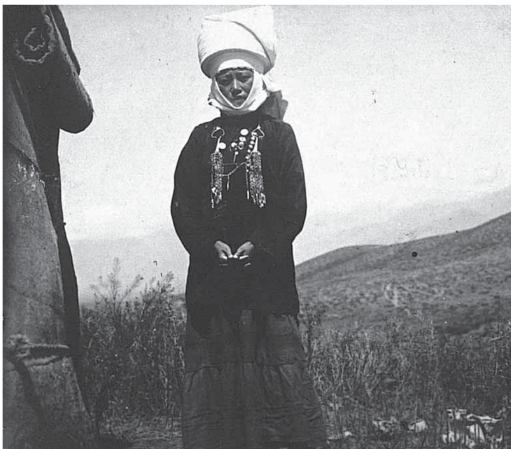
Рис. 3. Головной убор замужней киргизки. Негатив, фотоотпечаток. Киргизы. Киргизская автономная область. К. К. Юдахин. 1928 г. МАЭ № 3793-79