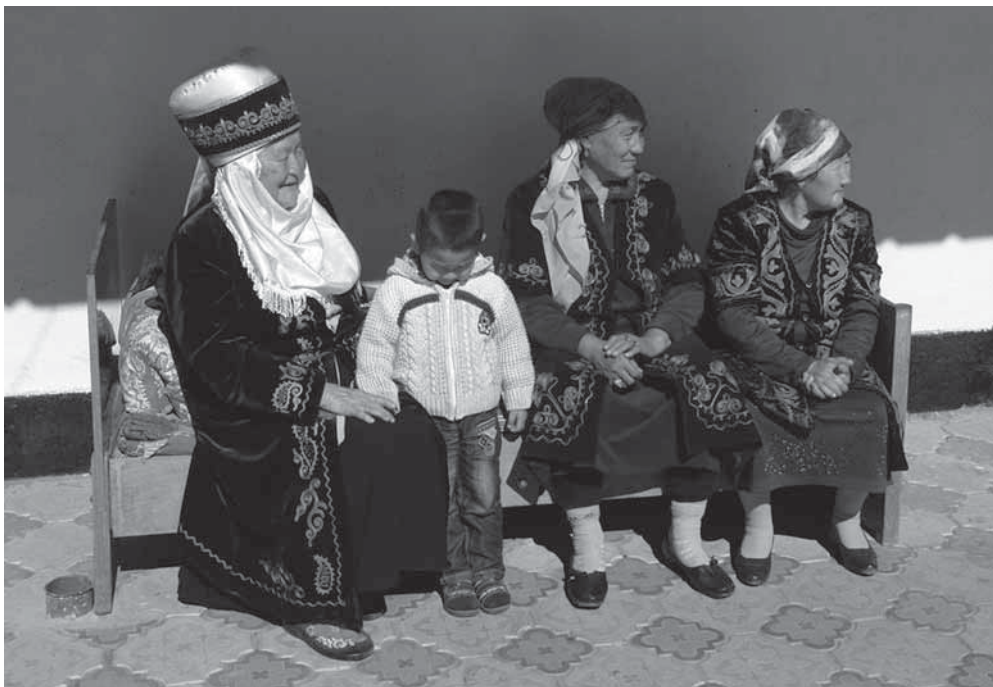
Рис. 15. Женщина в покупном элечеке. Фотоотпечаток. Киргизы. Иссык-Кульская область. И. В. Стасевич. 2013 г.

(рис. 16). Женщины, которые славятся таким умением, уважаемы в поселке, к ним обращаются за помощью в накручивании традиционного элечека , а некоторые просят научить их этим навыкам. Таким образом, знания о традиции накручивания и ношения элечека передаются из поколения в поколение традиционным способом, но имеют ограниченный локус существования (Стасевич 2017б: 312–320).