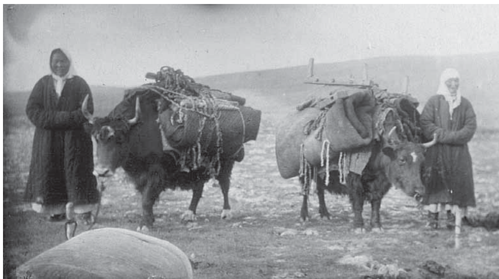
Рис. 7. Сложенная юрта и домашняя утварь, навьюченная на яков для кочевки. Негатив, фотоотпечаток. Киргизы. Семиреченская область, Нарынский район. Н. П. Дыренкова, И. Д. Старынкевич. 1926 г. МАЭ № 3661-11

В это время на севере Киргизии распространенным становится отрезное по лифу платье ( бүйүрмө көйнөк ), которое приходит на смену традиционному