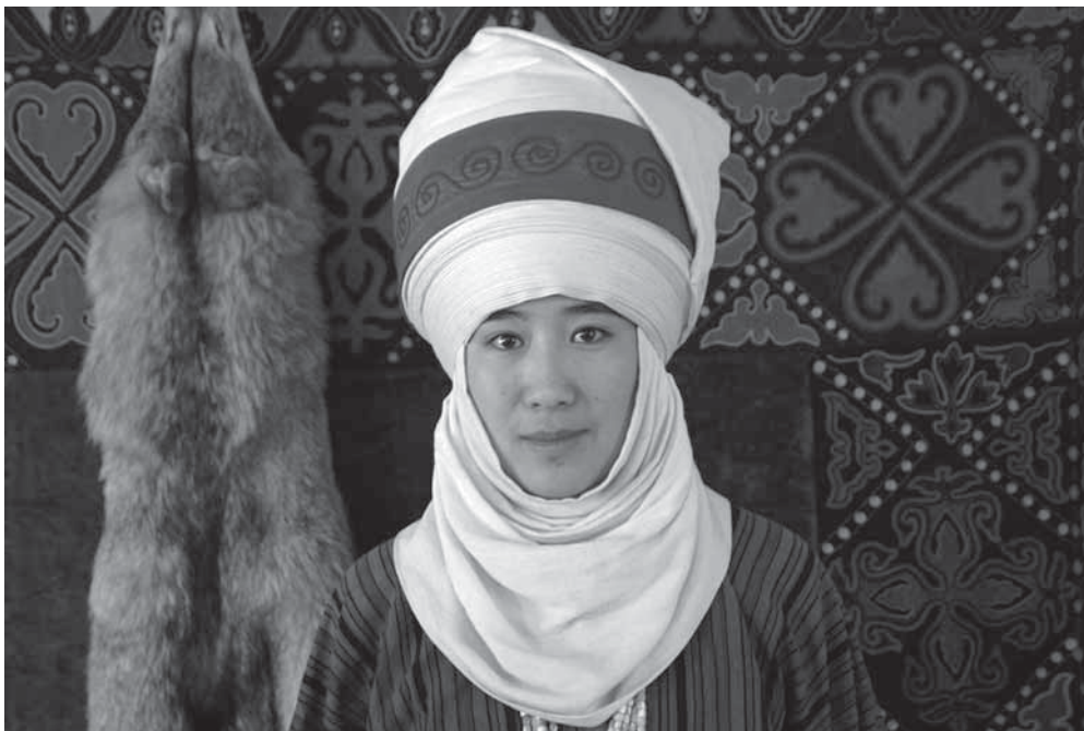
Рис. 17. Сотрудница центра «Кийиз дүйнө» в накрученном по традиции элечке . Фотоотпечаток. Киргизы. Г. Бишкек. И. В. Стасевич. 2016 г.

туникообразного кроя с длинными рукавами, умеют накручивать разные региональные типы элечек ов (рис. 17).