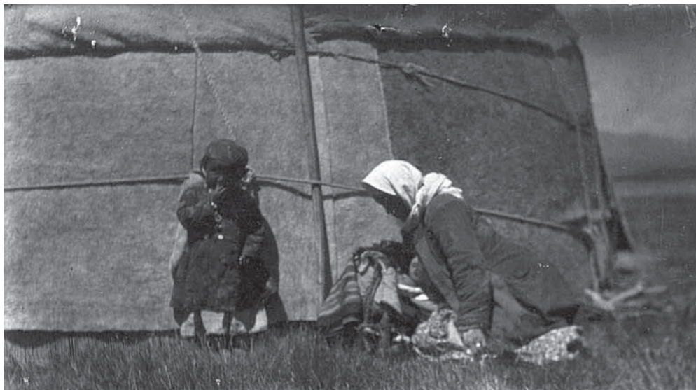
Рис. 9. Женщина кормит ребенка грудью, не вынимая из люльки. Негатив, фотоотпечаток. Киргизы. Семиреченская область, Нарынский район. Н. П. Дыренкова, И. Д. Старынкевич. 1926 г. МАЭ № 3661-19