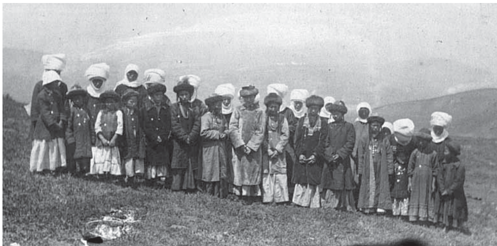
Рис. 4. Группа девушек в праздничных нарядах. Негатив, фотоотпечаток. Киргизы. Семиреченская область, Нарынский район. Н. П. Дыренкова, И. Д. Старынкевич. 1926 г. МАЭ № 3661-25