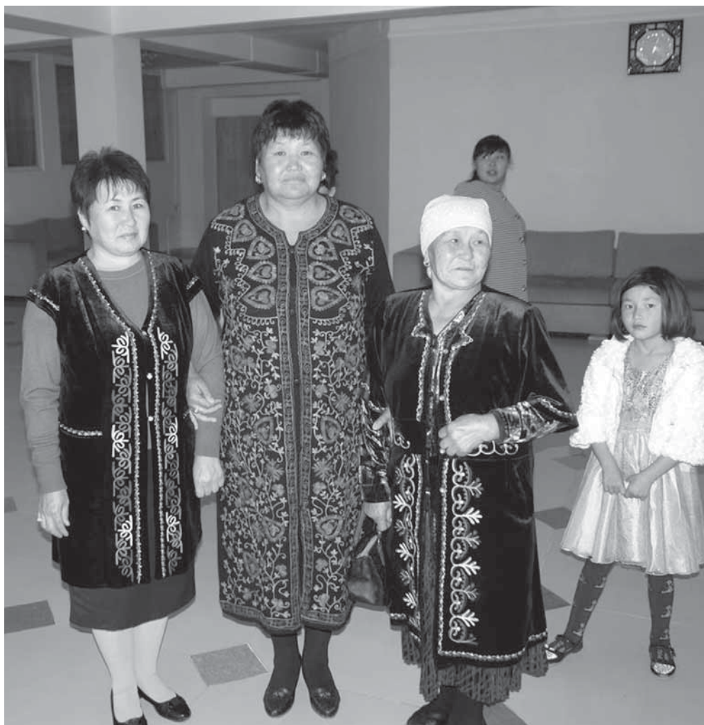
Рис. 14. Женщины в современных костюмах, сшитых в национальном стиле. Фотоотпечаток. Киргизы. Иссык-Кульская область. И. В. Стасевич. 2016 г.

Со временем региональные различия костюмного комплекса сгладились. Женщины путаются в традиционных названиях элементов костюма. Общим названием для вышитой верхней одежды в национальном стиле в настоящее время является широко употребляемый термин «сайма чапан» / «сайма чепкен». Так могут назвать и жилетку, как длинную, так и короткую, халат, безрукавку. Основной акцент переносится на традиционный способ декорирования предмета — «сайма» переводится с киргизского языка как «вышивка» (рис. 14).