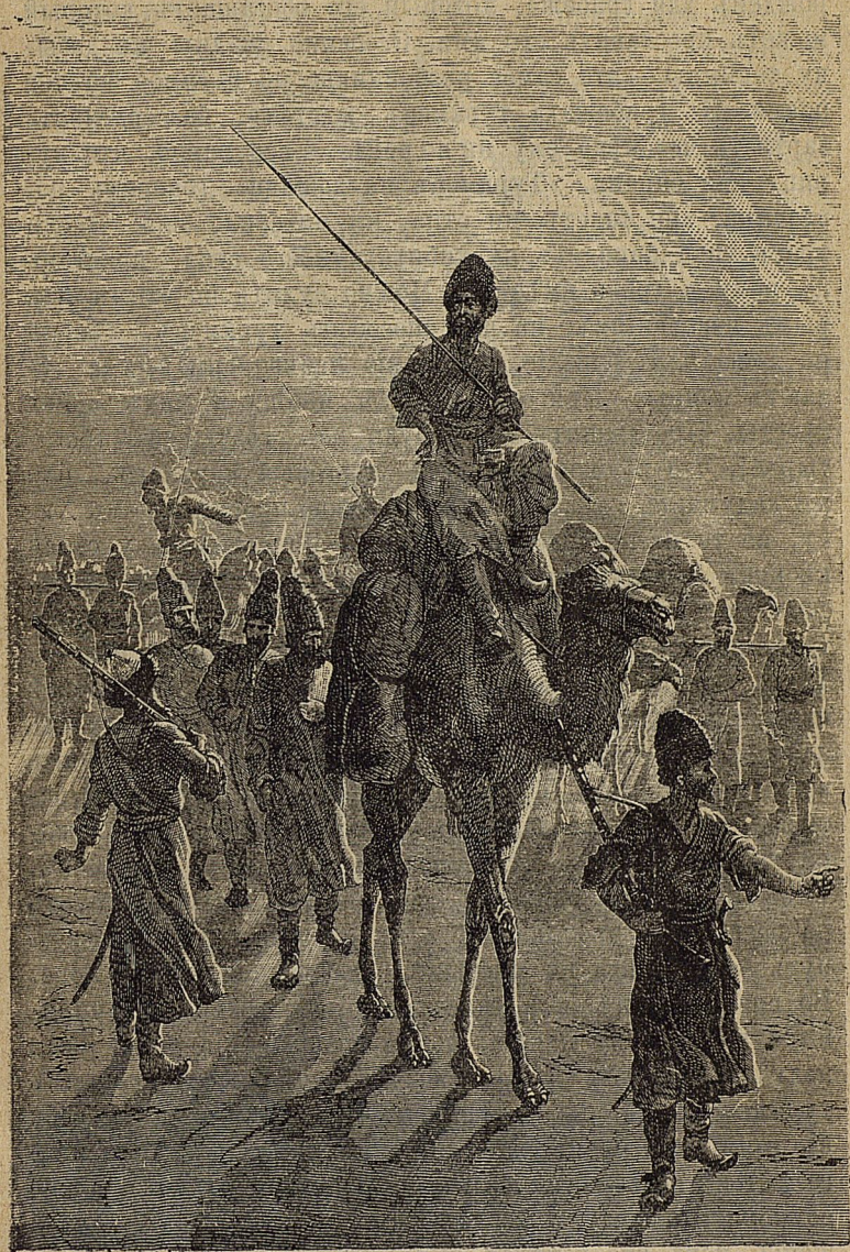
Туркмены на кочевьѣ.