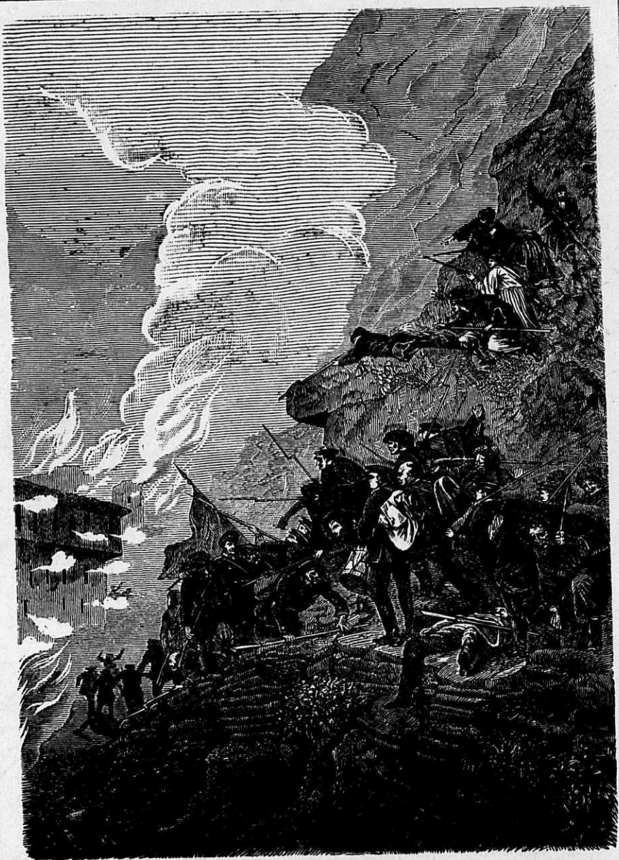
Штурмъ аула Китури, при которомъ смертельно раненъ генераль Вревскій. (20 августа 1858 г.)