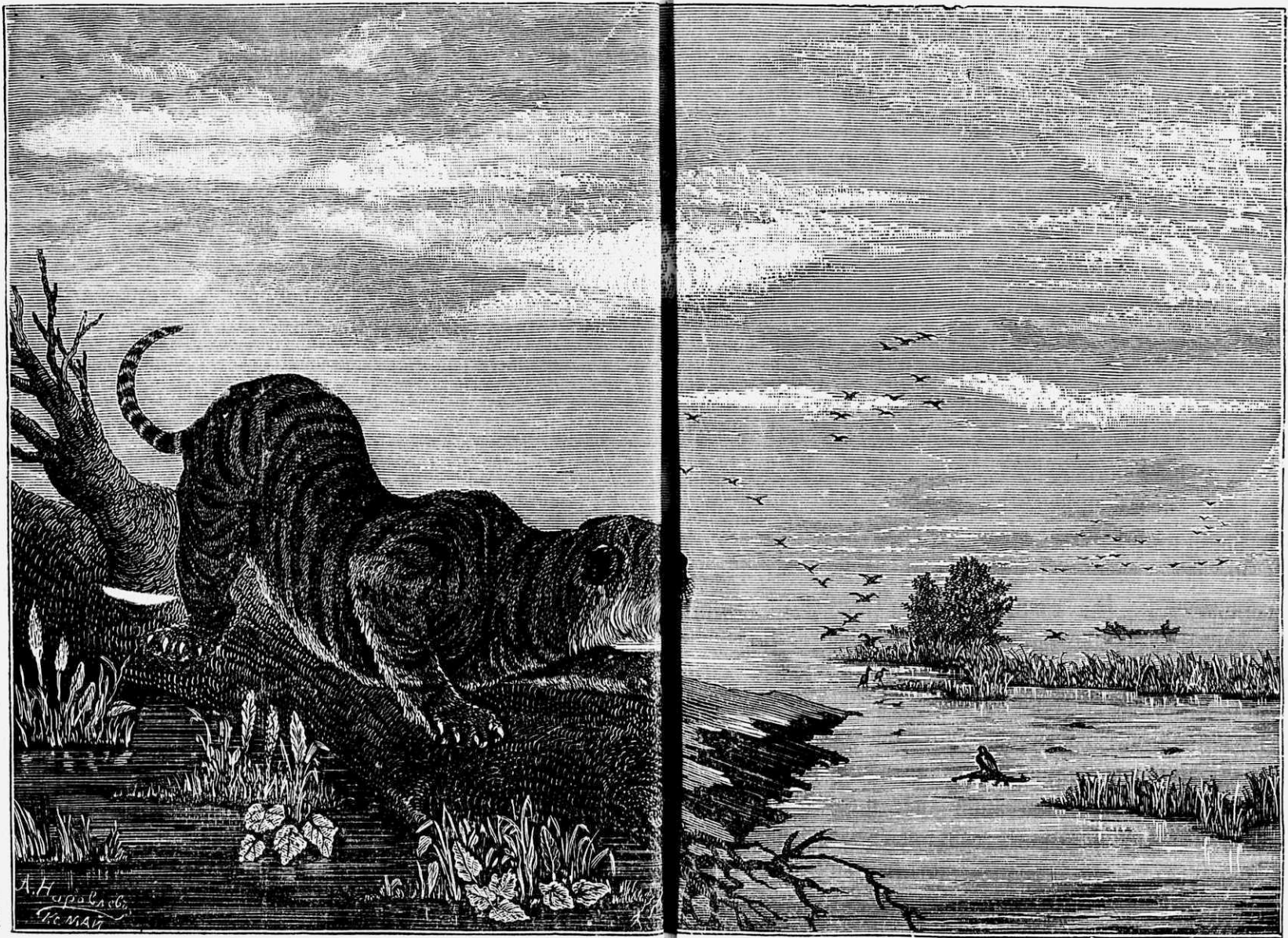
Тигръ спасающійся плавающимъ нѣ.