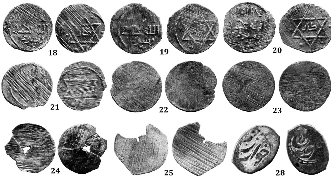
Илл. 2. Монеты средневекового Садвара

М/н: 1973, Город, Р-I. Квадрат З-14. Из такырного слоя (к югу от дома № 6. — Е. А.).