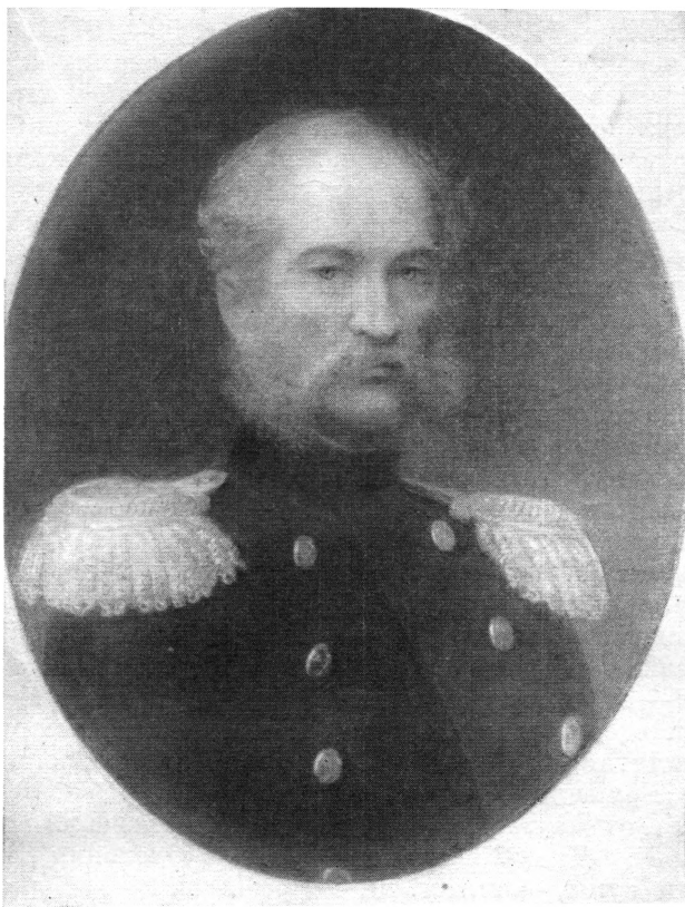
Рис. 1. Фото-копия портрета Е. П. Ковалевского работы художника И. Келера. Подлинник хранится в Институте Русской литературы (Пушкинский дом) АН СССР. Портрет публикуется впервые

Однако достигнуть Бухары русским путешественникам не удалось из-за событий, связанных с Хивинским походом В. А. Перовского.